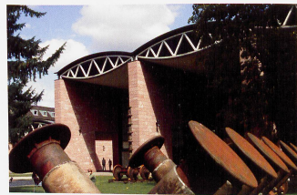
Bildlegende Bild oben rechts: Neue Tramstation Wettsteinplatz Bild Mitte: Alltag im Wettstein-Quartier Bild unten links: Tinguely Museum Bild unten rechts: Rheinpromenade im Wettstein-Quartier