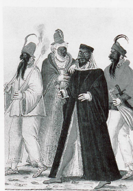
Bildlegende Bild oben: Mitte des 19. Jahrhunderts tauchen an der Basler Fasnacht die ersten grossen Laternen auf. Morgenstreich, 1866 Bild mitte: Zunftessen, 1853 Bild unten links: Älteste Darstellung der Basler Fasnacht, um 1590 Bild unten rechts: Kappeljoch-Laterne von Niclaus Strübin, 1858

Verwendete Literatur Heman Peter (Herausgeber), Unsere Fasnacht, Basel: Verlag Peter Heman, 1971. Meier Eugen A., Die Basler Fasnacht, Herausgeber Fasnachts-Comité Basel, 1985 Wunderlin Dominik (Hrsg.), Fasnacht, Fasnct, Carneval im Dreiländ. Basel: Schwabe Verlag, 2005. www.altbasel.ch