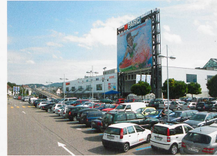
Bild oben Dreispietz Areal/Einkaufszentrum