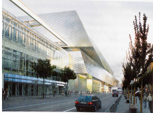
Bild oben Geplanter Messeneubau in Basel