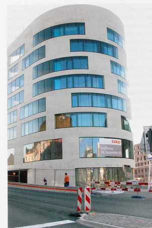
Bild S. 2 Baustelle beim Stückli