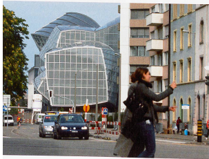
Bild oben Novartis Campus mit einem Gebäude von Frank Gehry