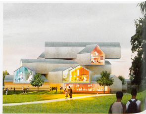
Bild rechts Vitra Haus (auf dem Vitra Campus), Weil am Rhein, Germany, © Herzog und de Meuron