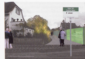
Bild links Links und rechts von der Baselstrasse grenzen hohe Mauern den Sarasinpark, das Berowergut samt der Fondation Beyeler sowie das Dorf von der Strasse ab.