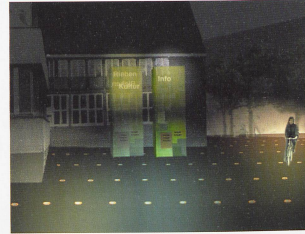
Bild oben links Gemeindehausplatz mit Pinwand