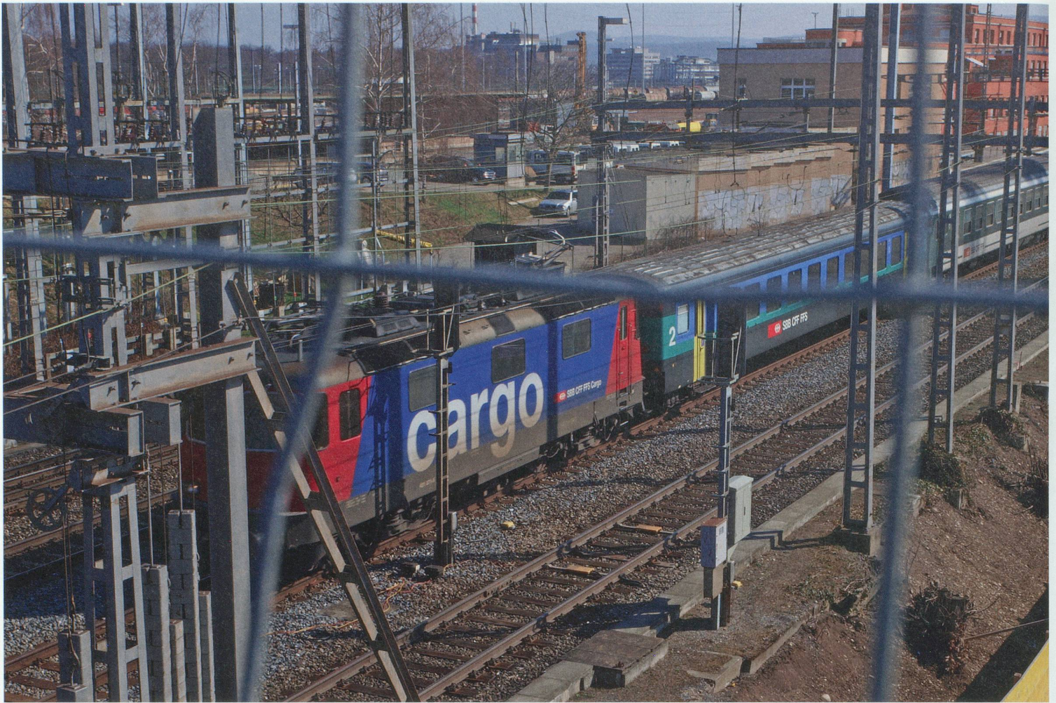
Eisenbahn bei Muttensz