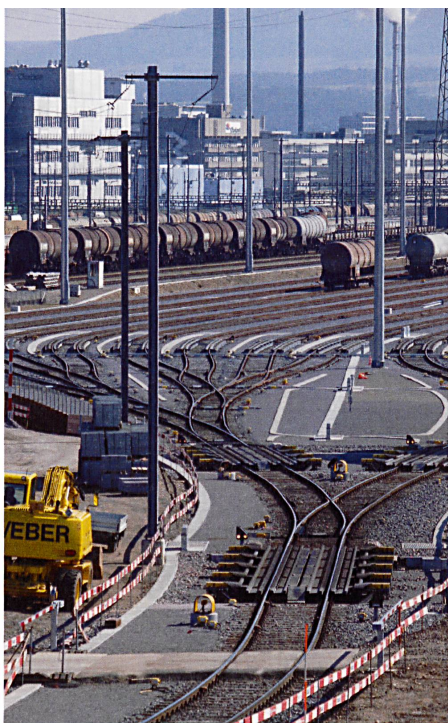
Über dem Grundwasser liegen der 4 km 2 grosse Güterbahnhof Muttenz und die dreispurige Autobahn A2

Diverse Artikel aus Basler Zeitung, Basellandschaftliche Zeitung und TagesWoche. Forter Martin, Farbenspiel. Ein Jahrhundert Umweltnutzung durch die Basler chemische Industrie, Zürich, Chronos Verlag, 2000. Forter Martin, Falsches Spiel. Die Umweltsünden der Basler Chemie vor und nach «Schweizerhalle», Zürich, Chronos Verlag, 2010. www.igdeponiesicherheit.ch www.tageswoche.ch www.admuttenz.ch www.hardwasser.ch