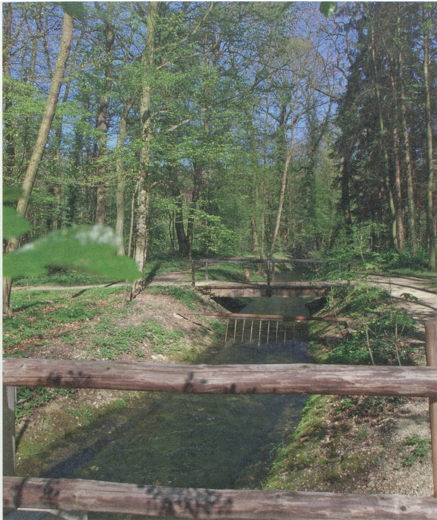
Hardwald im Frühling