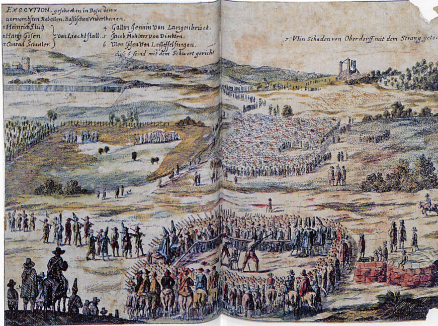
Hinrichtung der aufständischen Bauern am 14. Juli 1653, im Hintergrund Galgen mit Uli Schad

Nach 1648 rechnete man vergeblich mit der Abschaffung lästiger Abgaben. Weder eine Bittschrift noch ein Steuerstreik brachte Abhilfe. Die wirtschaftlich erschöpfte Landbevölkerung konnte sich nicht erholen. Was die Baselbieter zusätzlich erbitterte, war das obrigkeitliche Salzmonopol. Ein Eid verpflichtete sie dazu, das für Haushalt, Gewerbe und Viehwirtschaft unverzichtbare Salz nur an bestimmten Plätzen und zu festen Preisen zu kaufen, selbst wenn es in Solothurn oder im vorderösterreichischen Fricktal billiger zu haben war. Die Basler liessen ihre Landleute offensichtlich auch im Frieden im Stich.