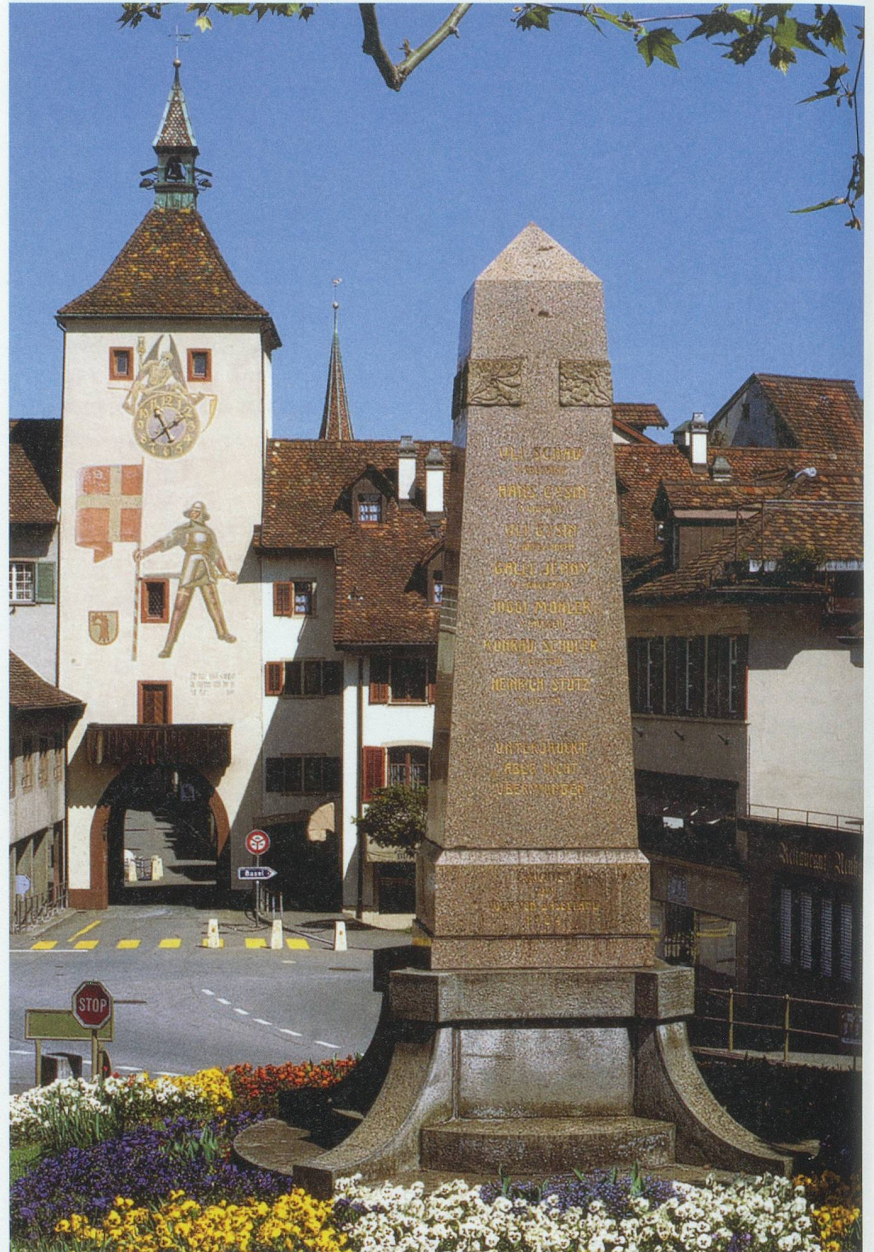
Denkmal in Liestal zur Erinnerung an den Bauernkrieg

Alle Urteile konnten jedoch nicht vollzogen werden. Mehrere zu Galeerenstrafen verurteilte Untertanen wurden während ihrer Überführung bei Rheinfelden von einer aufgebrachten Menschenmenge befreit. Sie stellten sich der Basler Obrigkeit und erhielten nun mildere Strafen. Für die sieben zum Tode Verurteilten gab es dagegen keine Wendung zum Besseren. Auf ihrem letzten Weg zur Richtstätte wurden sie der Bevölkerung vorgeführt, bevor sie «auff einer brügi oder Gerüst» vor dem Steinentor enthauptet, im Fall von Uli Schad, auf dem Gellert gehängt wurden. Alle Verurteilten waren Familienväter, Männer zwischen 50 bis über 70 Jahre, die durch ihr Amt und ihren Besitz eine hervorragende Stellung in der ländlichen Gesellschaft eingenommen hatten. Sie waren weder jugendliche Hitzköpfe noch Kriminelle, welche die Gunst der Stunde für ihre Zwecke nutzen wollten. Die «Gnädigen Herren», politisch und militärisch nur am Rande des Bauernkriegs, glaubten, mit dem blutigen Spektakel demonstrieren zu müssen, dass sie ihre Macht und Stärke wiedergewonnen hatten. Der Basler Gerichtsentscheid war – auch im Vergleich mit der übrigen Eidgenossenschaft – unverhältnismässig: Eine verunsicherte Herrschaft hatte jedes Mass verloren.