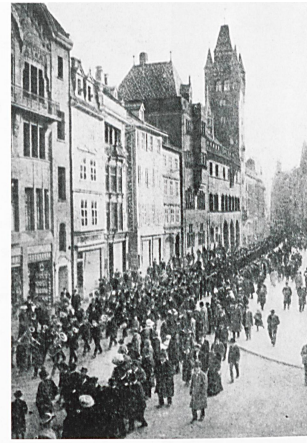
Bild links Marsch zum Münster anlässlich des Friedenskongresses

den Piz Scallotas auf der anderen Talseite. Auch wenn Conrad Ferdinand Meyer in seinem «Jürg Jenatsch» den Herzog von Rohan sagen lässt, der Heizenberg sei der schönste Berg der Welt, schlägt Leonhard Ragaz Herz stets für «seinen» Filmsenstein.