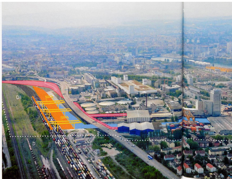
Bild links oben Vision Hafenbecken III