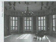
Im Gare du Nord

SONNTAG, 9. NOVEMBER 2014, 11.00 UHR Gare du Nord