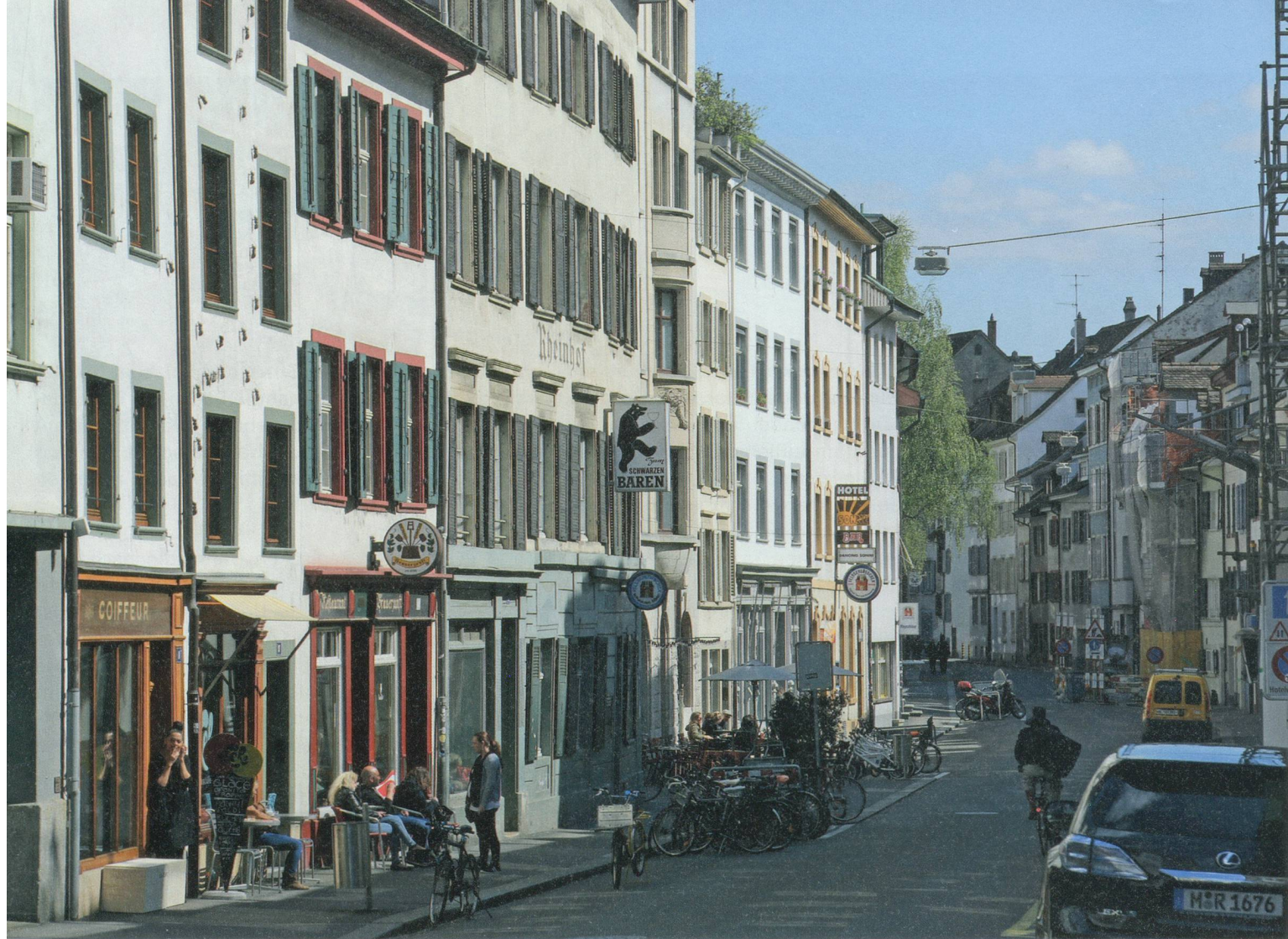
Bild oben An der Rheingasse

Jahren durch so manche durstige Kehle rinnen sollte. Dem neuen, aus rotem Sandstein erbauten Tempel badisch-schweizerischer Verbundenheit war keine lange Lebensdauer beschieden. Die hinter dem Bahnhof gelegenen Felder und Bauernhöfe wurden überbaut. Wie ein steinernes Krebsgeschwür wucherte die Stadt nach Norden. Neue Strassenzüge kamen: die Bleichen-, Erlen-, Fasanen-, Isteiner- und Mattenstrasse. Sie drohten den Bahnhof zu ersticken und so entstand an der mit Bäumen bepflanzten Schwarzwaldalle der heutige Badische Bahnhof, damals der grösste Auslandsbahnhof der Welt.