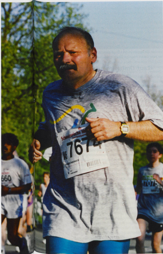
Held des Asphalts und...

meisten rennen weiter, als ob es gälte, die Kenianer einzuholen, die um diese Zeit bereits ein Viertel der Gesamtstrecke zurückgelegt haben. Dabei sind wir hier hinten die wahren Helden des Asphalts, jene, die noch nicht einmal wissen, ob sie das Ziel überhaupt erreichen werden. Es ist ruhig geworden, nur noch wenige reden. Die Gesichter und Nacken sind schweisnass. Man hat keinen Blick mehr für die zu Stein gewordene Grossmannssucht von Berlin Mitte.