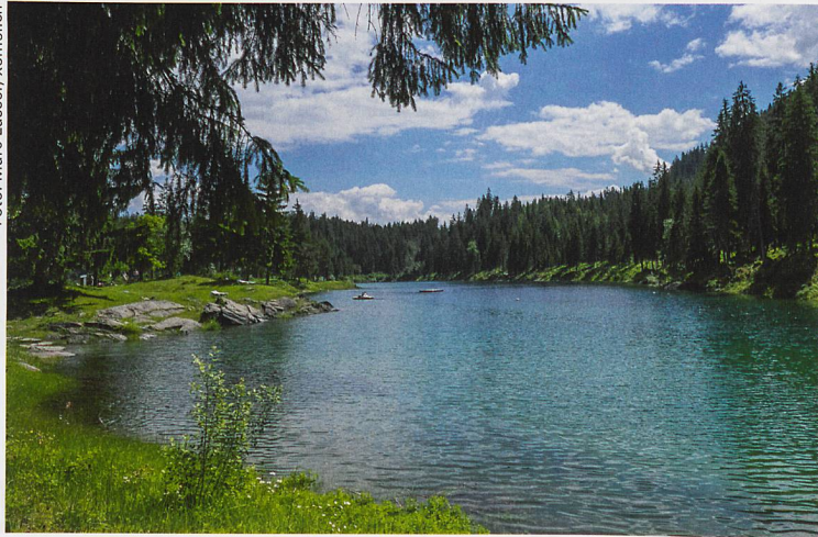
Der Caumasee im Sommer