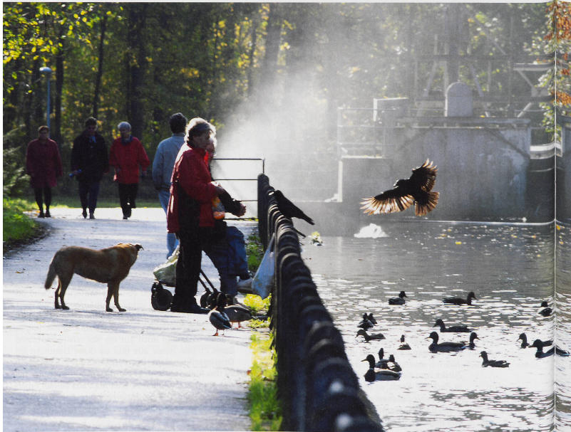
Enten füttern... ▲ ...mit dem Hund an der Wiese nach Lörrach spazieren... ► ... und Herbstsonne tanken. ►►