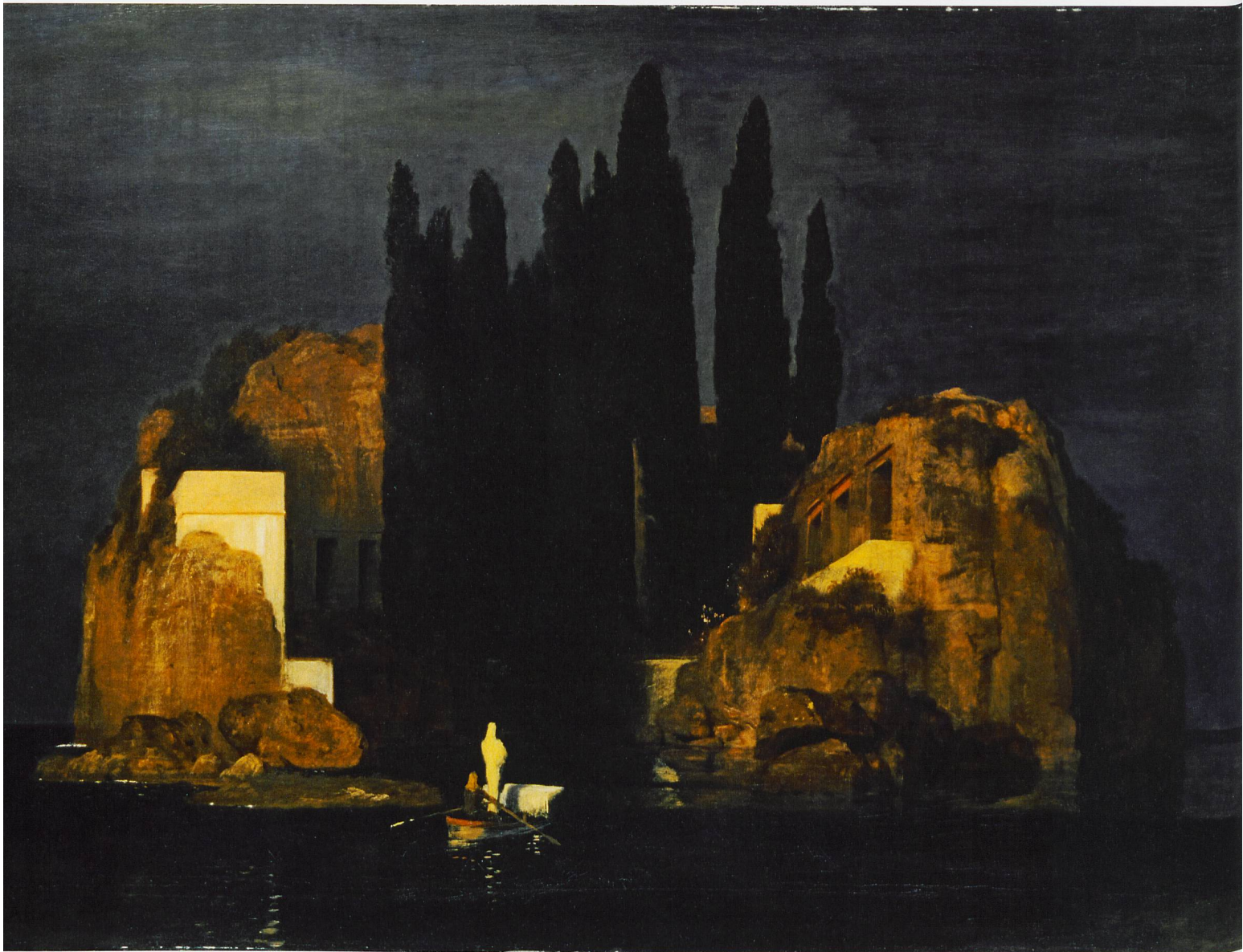
«Die Toteninsel» von Arnold Böcklin, eines der wichtigsten Werke des Symbolismus, Urversion von 1880.

Kunstmuseum Basel