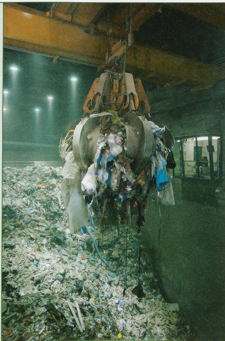
Greifer im Müllbunker.

Weitere interessante Führungen finden Sie auf Seite 50.