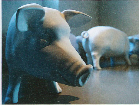
Georgios Kefalas, © Museum BL

Sa, 14. Juli, 10–19 Uhr, Innenstadt Lörrach, www.stimmen.com