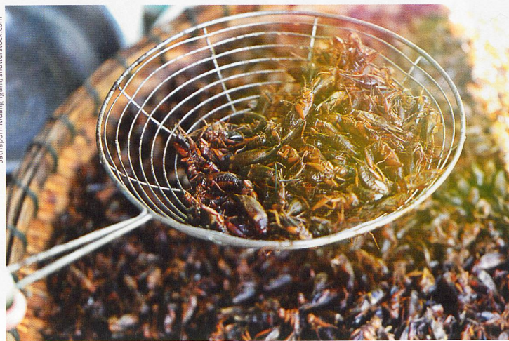
Insekten zum Z'nacht?

Für über zwei Milliarden Menschen weltweit gehören Insekten schon lange zum festen Speiseplan. Inzwischen werden Insekten wie Würmer oder Grillen in mehreren Varianten auch in der Schweiz angeboten. Als Pionier hierzulande hat Coop die Regale damit aufgefüllt. Der Detaillist arbeitet auf diesem Gebiet eng mit dem Start-up-Unternehmen Essento zusammen und brachte 2017 den ersten Insekten-Burger auf den Markt. Zur weiteren Produktpalette zählen nach Angaben von Essento auch Insect Balls (Hackbällchen), der Insect Bar – ein Energie-Fruchtriegel mit Grillenmehl – sowie Snacks mit Nüssen und ganzen Insekten.