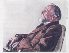
Ferdinand Hodler: Bildnis Carl Spittlers, 1915

Führungen: 12. Mai, 14. Juni, 19. Juni, 18. Juli, 6. Juli, 11. Juli → frauenstadtrundgang-basel.ch