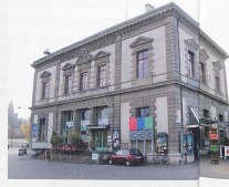
Kulturhaus Palazzo, Liestal

Ausstellung: 30. März–19. Mai, Di–Fr, 14–18 Uhr; Sa/So, 13–17 Uhr, Jubiläumsfest: 9.–11. Mai → palazzo.ch