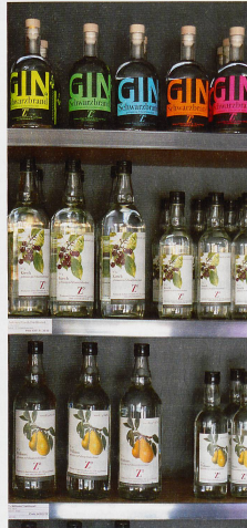
▲ Gin, Kirsch und Williams aus dem Schwarzbubenland