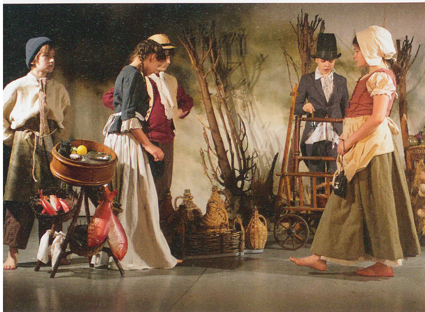
Szene aus «Die kleine Hexe Patallo».

Es gibt Talentierte und weniger Talentierte. Eingesetzt werden sie ganz nach ihren Möglichkeiten. Leidenschaft ist bei allen dabei und sehr viel Professionalität. Beim Bühnenbild zum Beispiel, das schon seit achtzehn Jahren von George Steiner geschaffen wird, dem Künstler und Profi, der Kinofilme wie «Der Medicus» ausgestattet hat und grosses Renommee in der Szene geniesst. Er hat das Kindertheater optisch mit seiner Handschrift geprägt, bereits im Eingang lässt er das Publikum in seine Welt eintreten, die wunderbare und ganz eigene Märchenwelt. Jedes Bühnenbild unverwechselbar George Steiner, auch er zeichnet mit am roten Faden, der sich durch das Basler Kindertheater zieht.