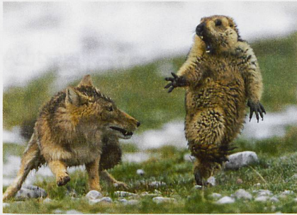
Wildlife Photographer of the Year. Der Moment