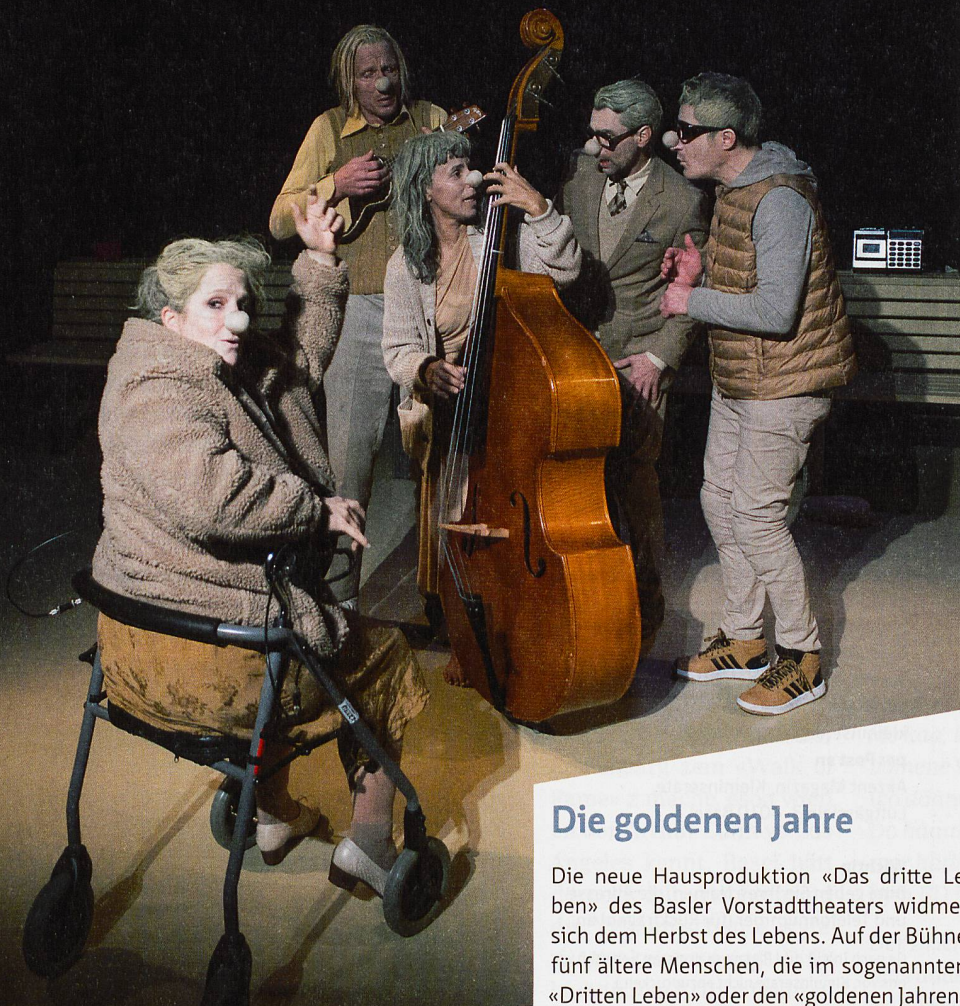
Szene aus «Das dritte Leben».