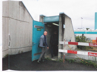
◀ Der Zugang zum Abwasser

▲ Mehr als 78 000 Kubikmeter Abwasser reinigt die Pro Rheno pro Tag.