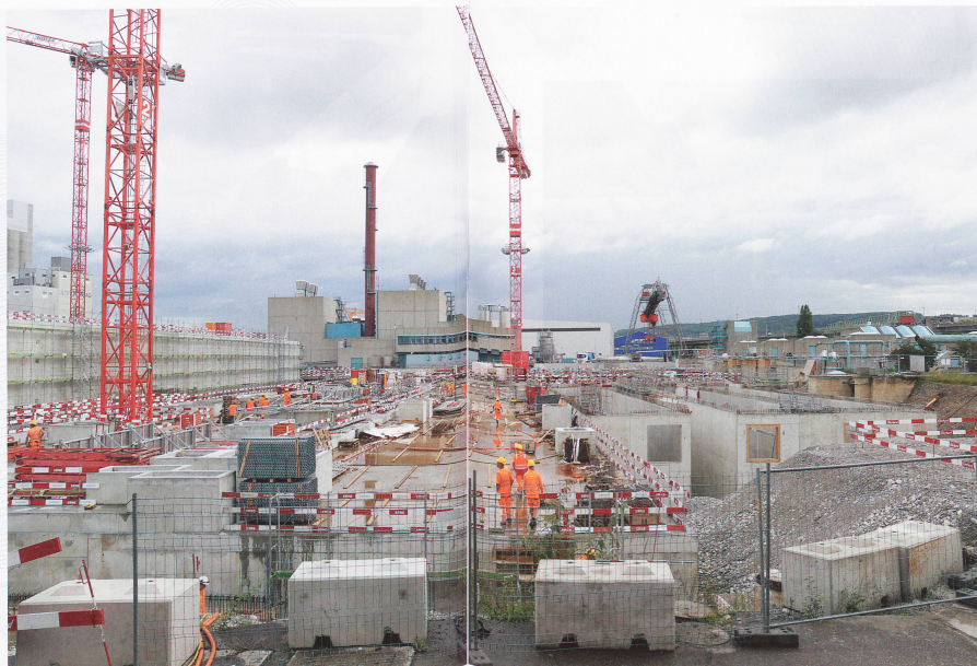
Mit der neuen Anlage können in Zukunft auch Stickstoffe aus dem Abwasser eliminiert werden.

überschreitungen bei den ungelösten Stoffen und beim gelösten organischen Kohlenstoff. Dieser nicht sehr befriedigende Zustand wird mit der Inbetriebnahme der neuen Anlage nun bald behoben.