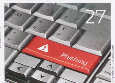
Gefährliche Tasten ...

bajour 21 Von analogen zu digitalen News