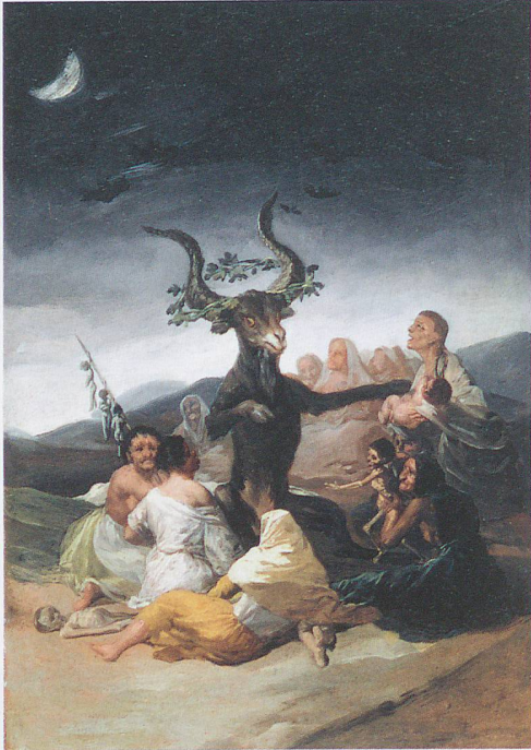
Francisco de Goya: Hexensabbat (El aquelarre), 1797/98