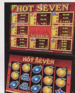
Spielsucht ist eine Krankheit.