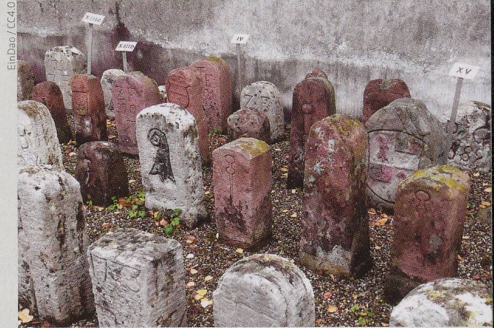
Alte Grenzsteine innerhalb der Ringmauer der Wehrkirche St. Arbogast in Muttenz.

Die Ausgabe 2/2022 erscheint Anfang April mit dem Schwerpunktthema «Gemeinden».