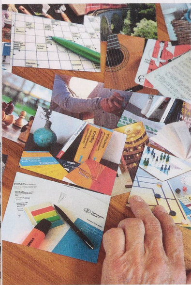
Das Programm «BrainCoach» empfiehlt viele Aktivitäten – darunter auch Spiele.