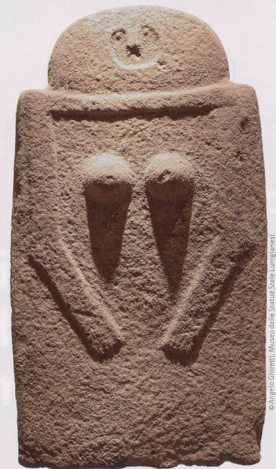
Moncigoli I aus Fivizzano in der Toskana. Der Sandstein, der 1910 gefunden wurde, datiert vom 3. Jahrtausend vor Christus.

Schweizerisches Nationalmuseum (Hg.): «Menschen in Stein gemeisselt» Christoph Merian Verlag, Basel 2021 ISBN 978-3-85616-961-9