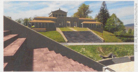
So sah der Schönbrühl-Tempel zur Römerzeit aus.

Moser Beat: «26mal Schweiz. Wissenswertes, Charakteristisches, Sonderbares» BEMO Verlag, Sissach 2021 ISBN 978-3-033-08506-0