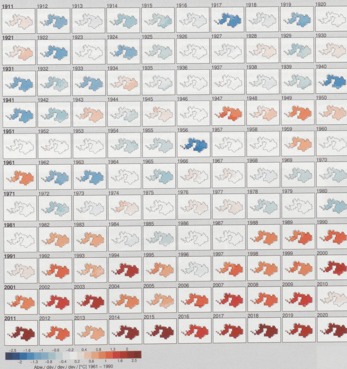
◀ jährliche Temperaturabweichungen vom Mittel 1961–1990 [°C] für die Jahre 1911–2020 im Kanton Basel-Landschaft

→ nccs.admin.ch/nccs/de/home/klimawandel-und-auswirkungen/schweizer-klimaszenarien.html