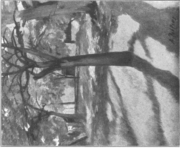
Alfred Rehfuß Baumgarten