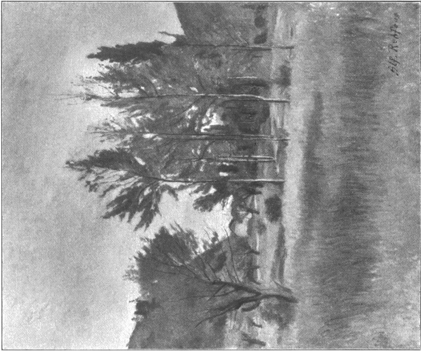
Alfred Rehfuß Landschaft