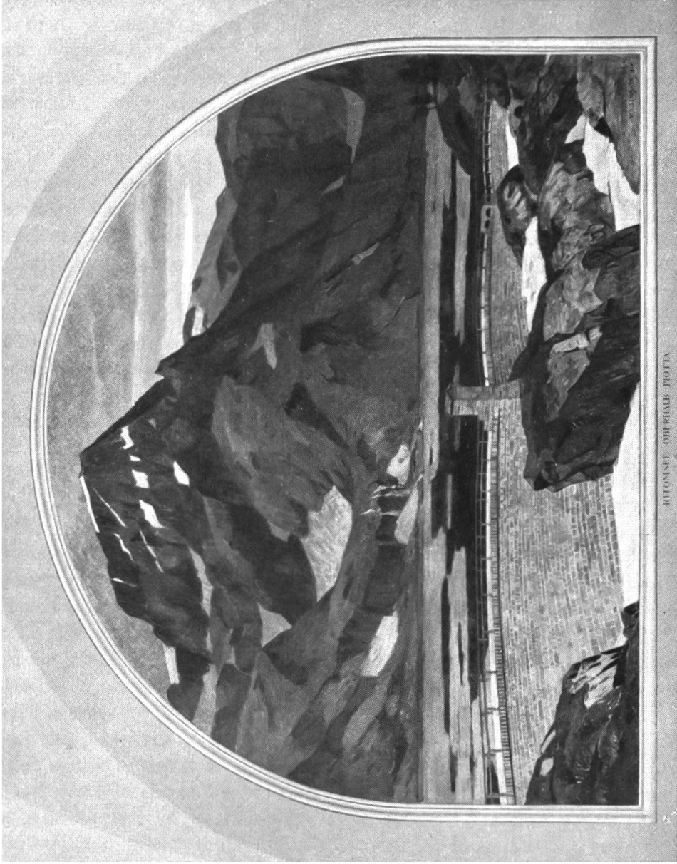
ROTUNDE - OBERHADE - FROTTA