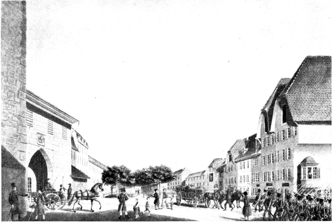
Beim Obertor um 1830 Colorierte Zeichnung von J. Wärtli in der Sammlung Alt-Aarau