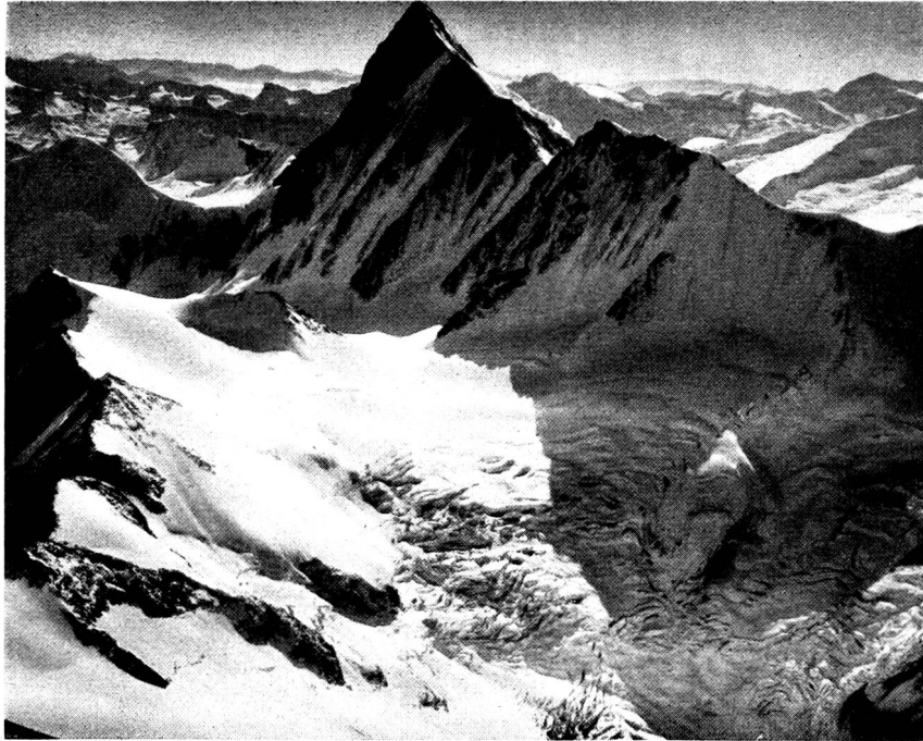
Finsteraarhorn von Nordosten (Aufstieg Meyers über den Grat links im Bilde)