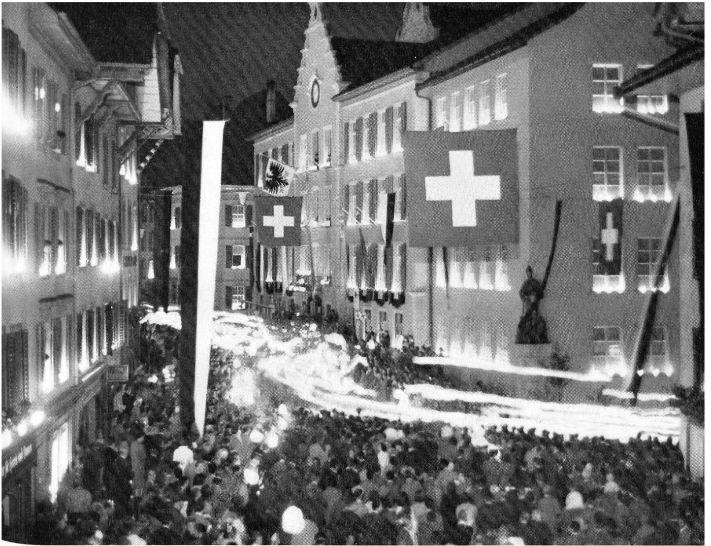
Bachfischet-Défilé vor Aaraus Steuermann und Steueramt Rathauseinweihung am Abend des 7. September 1957