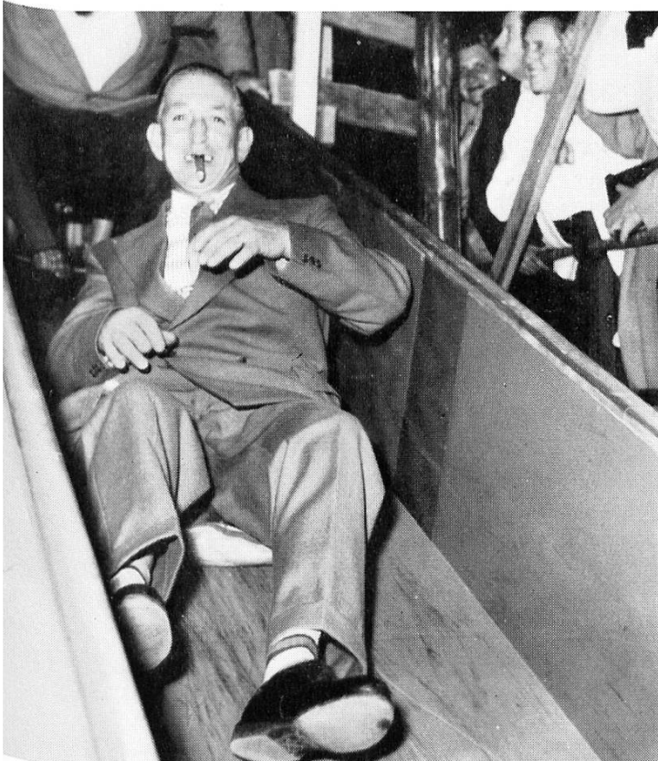
Rutschbahn in der Halde ...