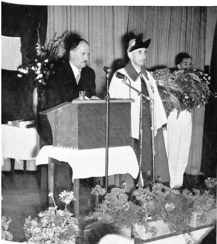
Bundesrat Chaudet am ETV-Jubiläum im Saal zur Kettenbrücke, 19. Mai 1957