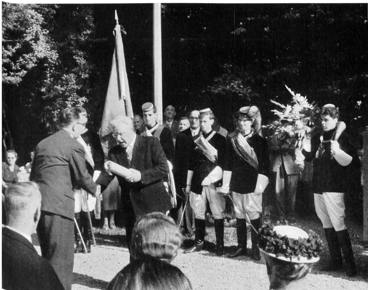
100 Jahre Kantonsschülerverbindung Industria Aarau. Übergabe des Geschenkes von 5000.- Franken an die Kantonsschule. 29./30. August.