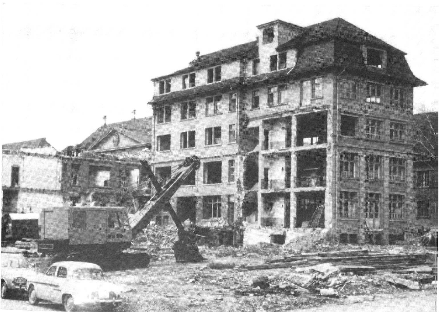
Oben: Architekturstudenten der ETH hatten als Seminararbeit Modelle für einen Aarauer Theaterneubau erstellt, die im Rathaus Gegenstand einer vielbeachteten Ausstellung waren.