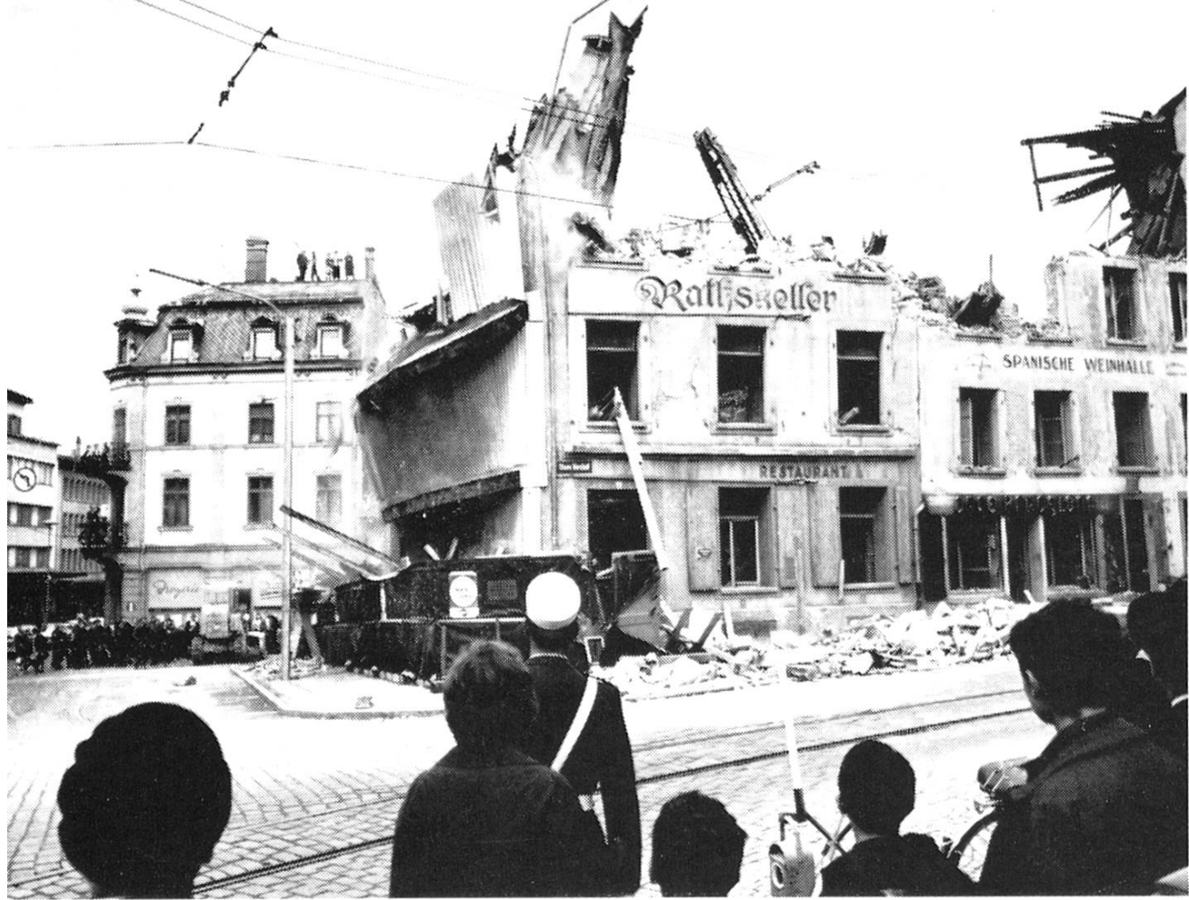
«Ratskeller» und «Spanische Weinhalle» fallen: Hier entsteht die neue Behmenüberbauung.

Motorfahrer aus der ganzen Schweiz trafen sich in unserer Stadt.