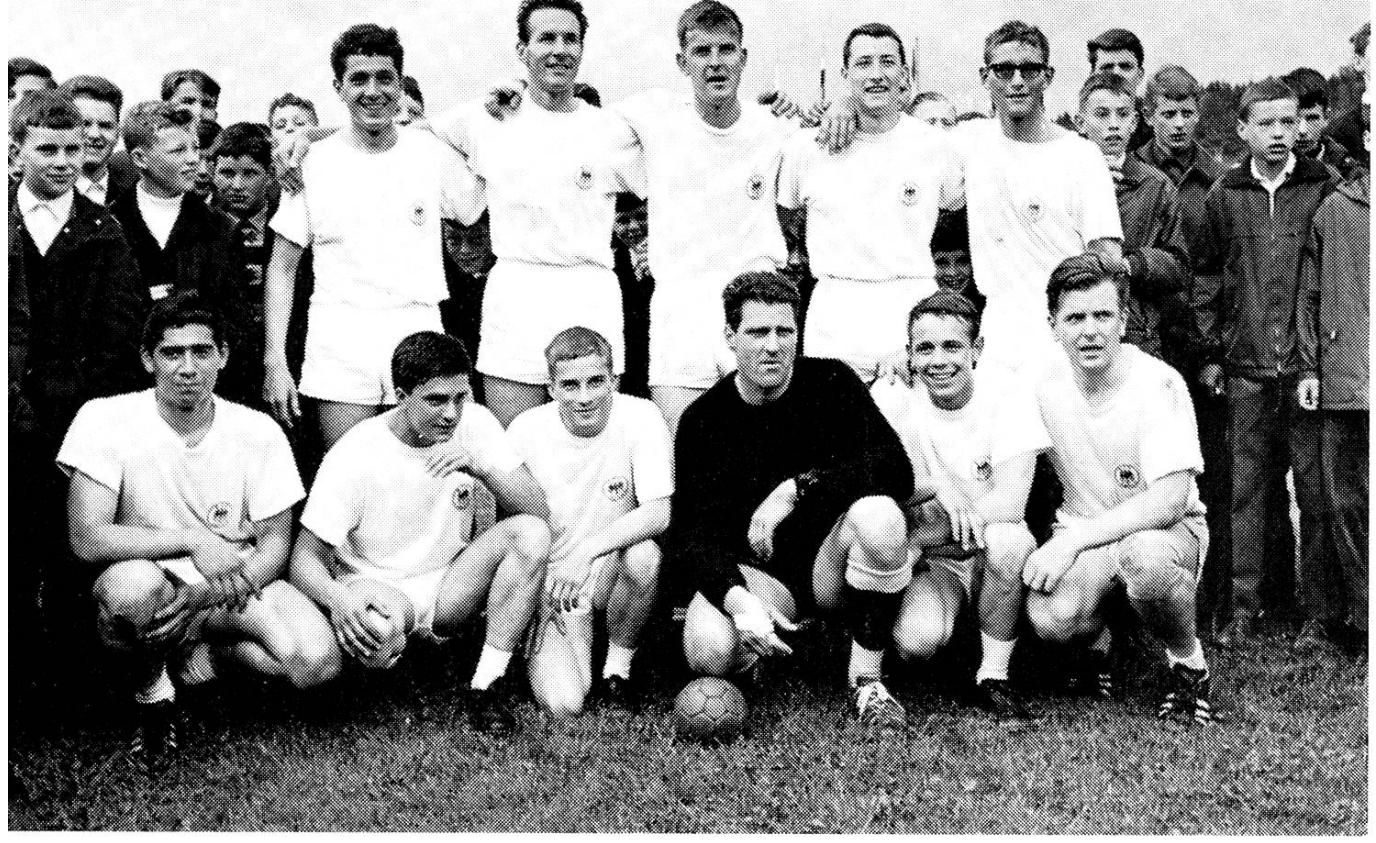
Die erfolgreiche Aarauer Handball-Mannschaft nach dem Sieg im Agfa-Cup. Beat-Konzert im Saalbau: Modeströmungen in bezug auf Musik und Frisur machen auch vor unserer Stadt nicht halt.