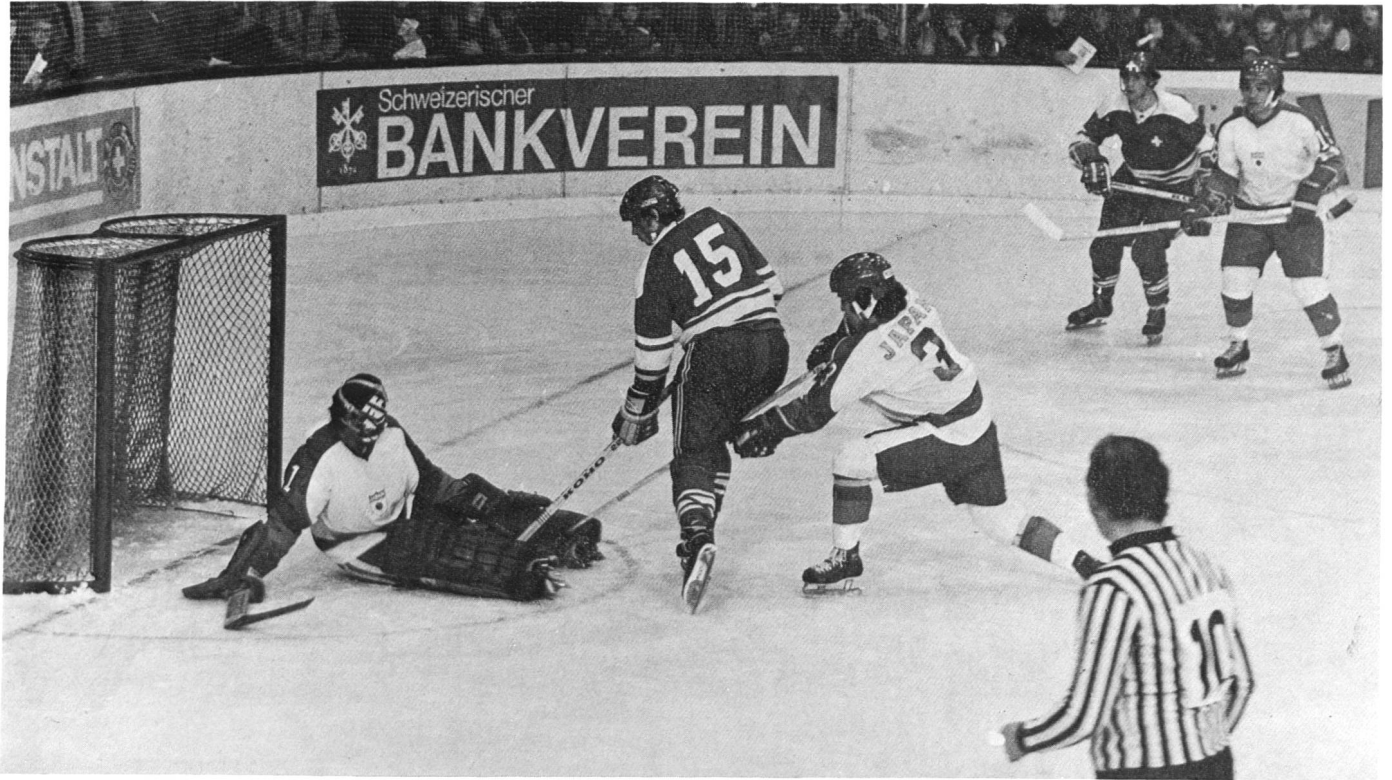
B-Turnier der Eishockey-Weltmeisterschaft auf der Aarauer Keba (aus dem Spiel Schweiz – Japan).