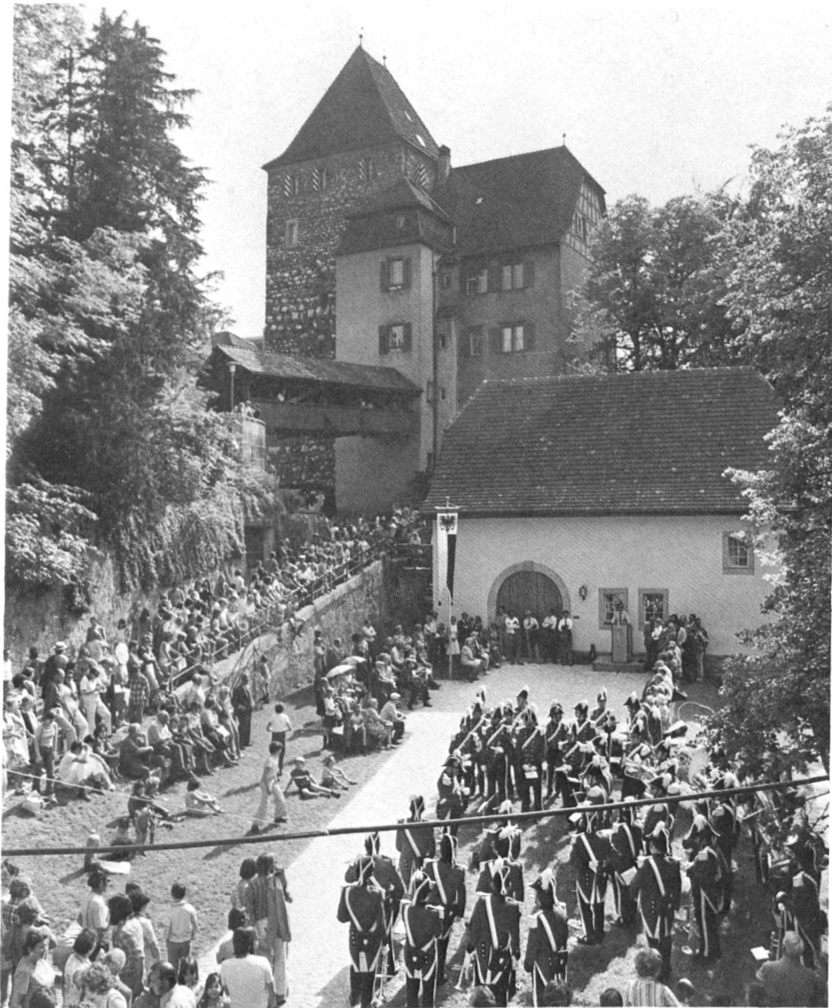
Übergabe der neu erstellten historischen Mühle im Hammer.