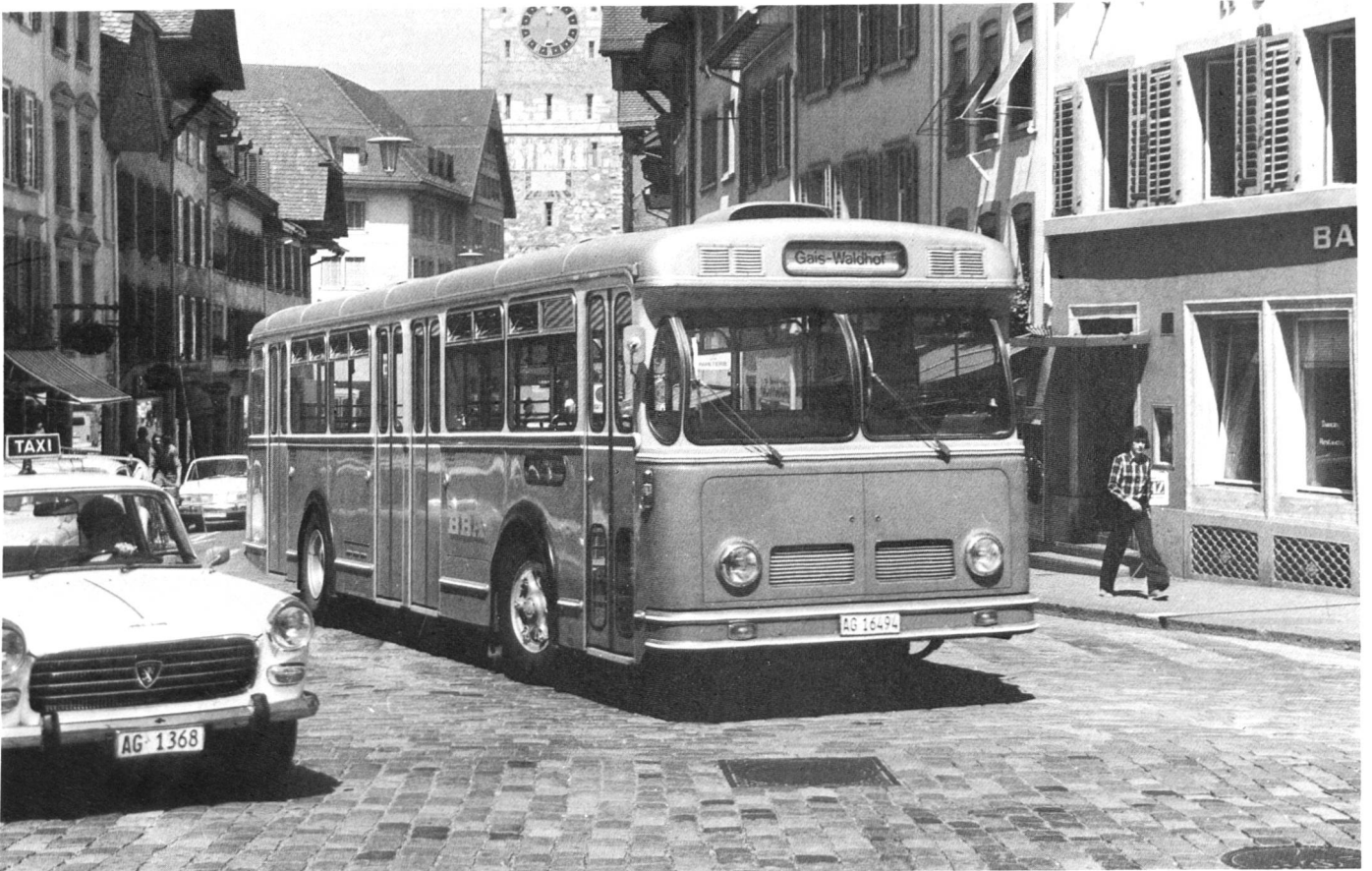
Nach dem Ausbau der BBA rollt der Regionalbus durch Aarau.