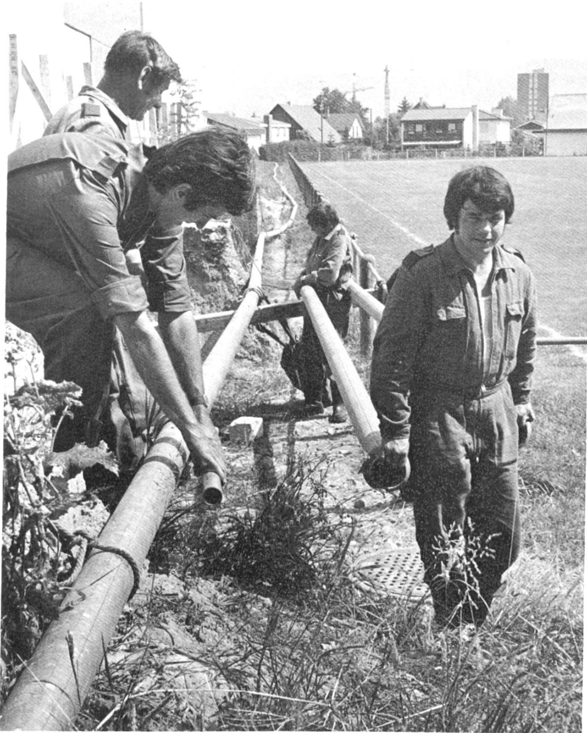
Bewässerungsaktionen während der Dürreperiode. Der Zivilschutz legt die nötigen Leitungen.