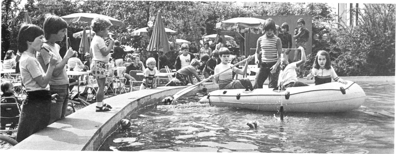
Eine Kantonsschulklasse führt ein «Wässerle» für Aarauer Kinder durch.