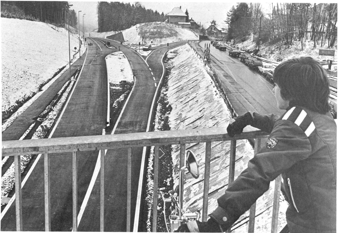
Der Autobahnzubringer Distelberg wird in Betrieb genommen.