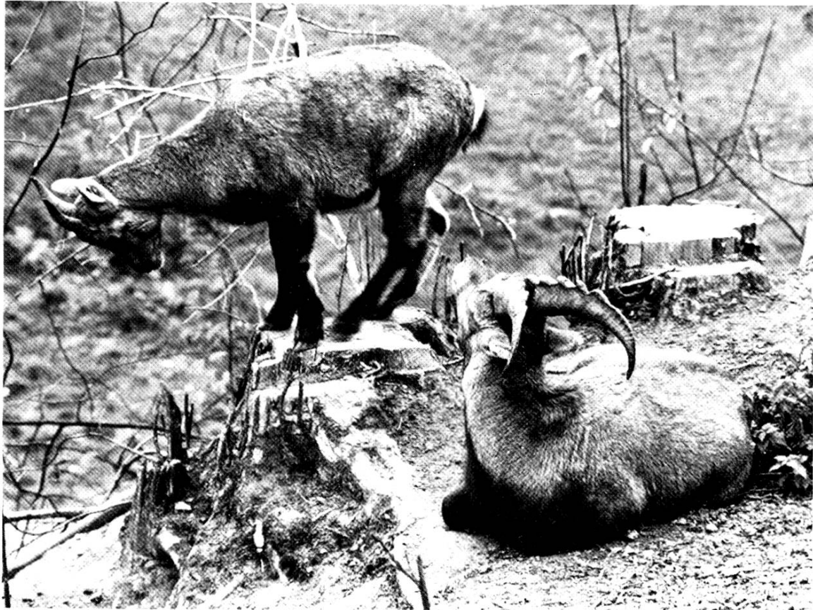
Steinwildpaar, eingesetzt am 15. Juni 1978

schossen werden muss, werden alle Ausreisser wieder zurückgetrieben. Das Wildparkkomitee fasst den Entschluss, die Schutz- und Futterhütten einer eingehenden Renovation zu unterziehen und zum Teil neu zu errichten. Die Kosten belaufen sich voraussichtlich auf rund 70 000 Franken. Das Parkgitter wird instand gestellt. Vor allem der Zaun um die Aufforstung herum muss repariert werden, da bereits schwerwiegende Schältschäden entstanden sind und zahlreiche Bäume absterben. Die Ortsbürger bestätigen in der Urnenabstimmung vom 2. Juli den Beschluss der Ortsbürgergemeindeversammlung vom 5. Juni, wonach für den Umbau der Wirtschaft ein Baukredit von Fr. 1 592 000.– bewilligt wird. An der Versammlung stimmen 127 Ortsbürger dafür, 47 dagegen; an der Urnenabstimmung sind es 454 Ja-Stimmen gegen 98 Nein-Stimmen.