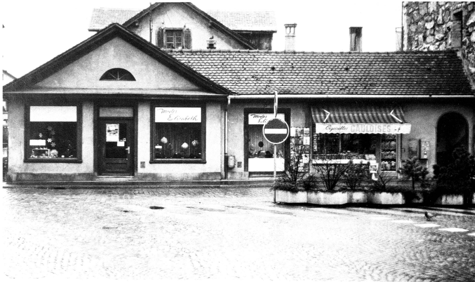
Abb. 2 Die ehemalige Landjägerwache heute. Der Dreiecksgiebel und die klare Gliederung der Fassade verraten etwas von der besonderen Baugeschichte des im Volksmund als «Gewerbehalle» bekannten Gebäudes.