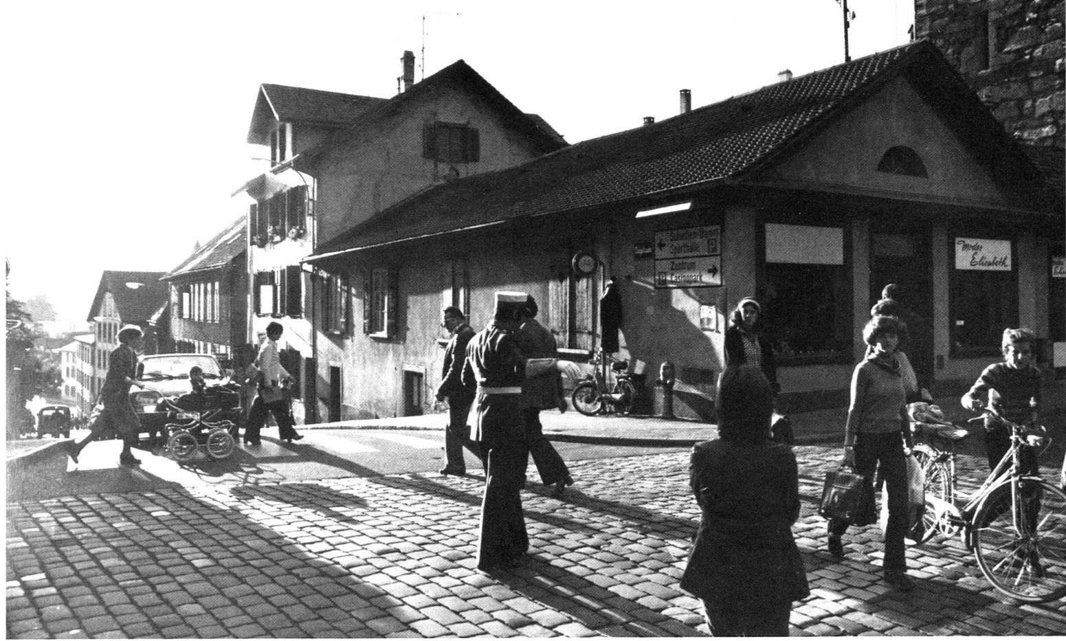
Abb. 4 Die ehemalige Landjägerwache erhält ihre besondere Bedeutung einerseits als Kopfbau der Häuserzeile am Ziegelrain, andererseits als typischer Vertreter der klassizistischen Bautradition in Aarau zu Beginn des 19. Jahrhunderts.