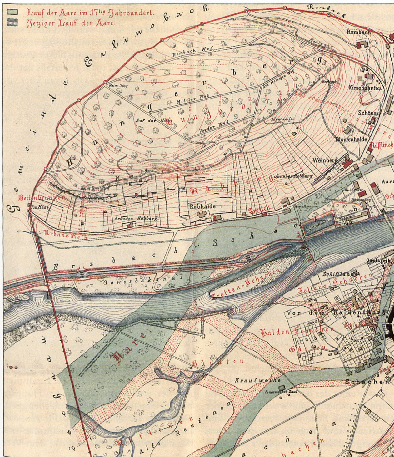
4 Flurnamen als Hinweise: «Trotten-Schachen», «Weinberg» und «Rebhalde» als eindeutige Zeugen längst vergangener Weinkultur am Aarauer Hungerberg (Historischer Plan der Stadt Aarau, 1879).