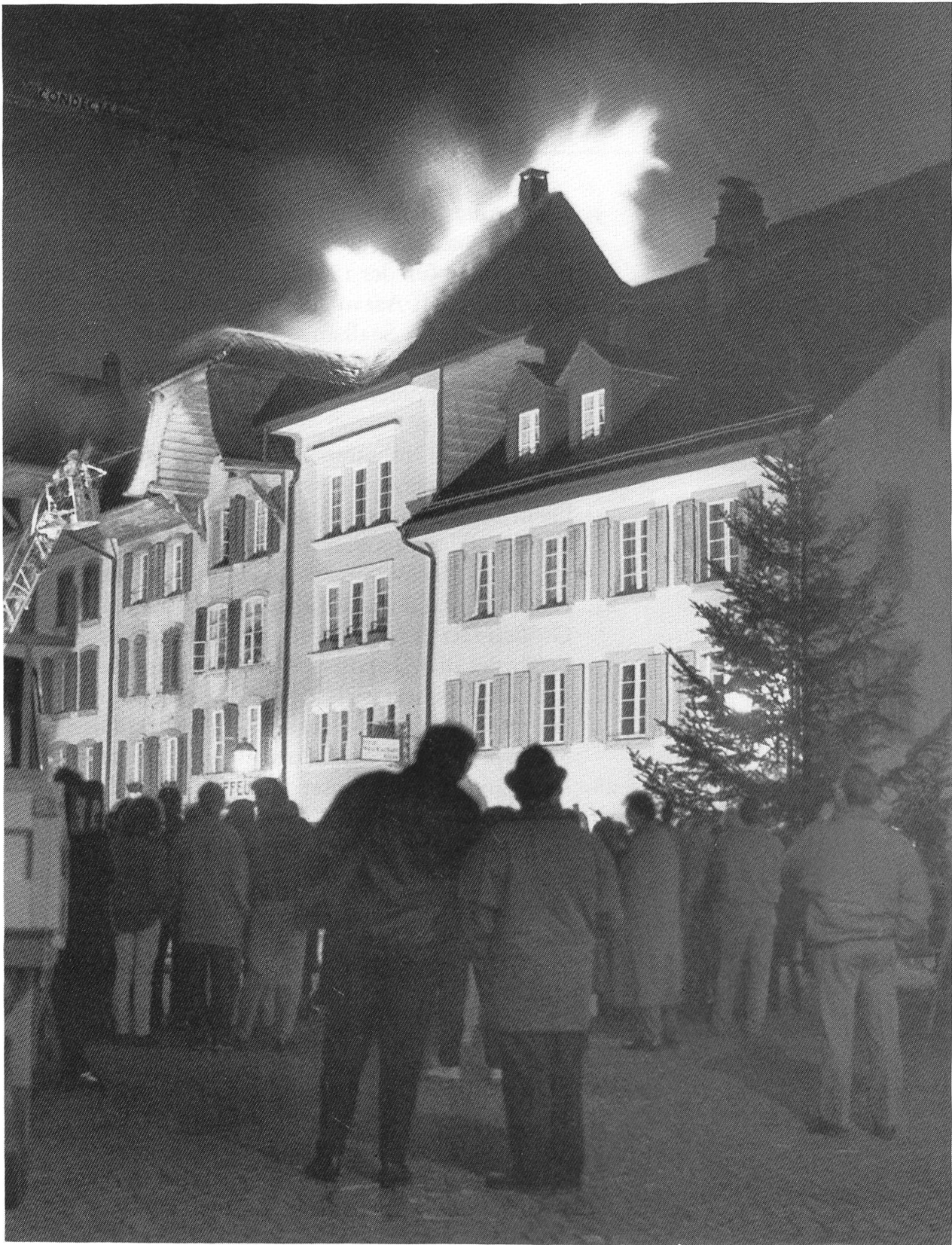
I Glimpflich abgelaufen: Großbrand in der Kirchgasse.