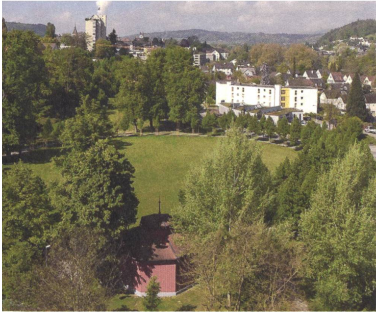
↑ Der Aarauer Telliring im Mai 2017.

Zu Beginn der 1970er-Jahre wäre es dem ehrwürdigen Turnplatz beinahe an den Kragen gegangen. Stadt und Kanton planten eine mehrspurige Aaretalstrasse und eine Nordumfahrung, die nicht nur den Aareufferraum, sondern auch den grösseren Teil des Tellrings beansprucht hätten. Stadt- und Einwohnerrat wären mehrheitlich zu diesem Opfer bereit gewesen, die Aarauer Stimmbürger aber legten an der Urne 1971 ihr Veto ein und verwarfen das Projekt deutlich.