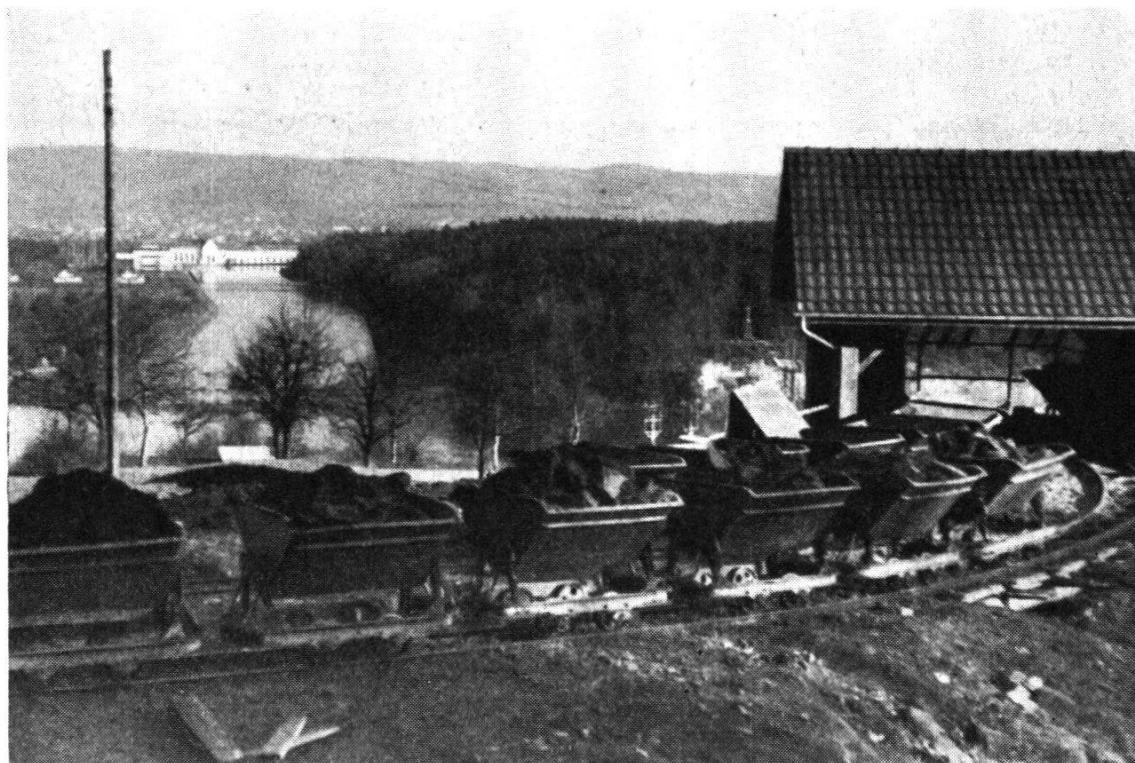
Abb.11. Tonsteine auf Rollwagen, Seilbahn über die Aare durch den Wald zur Fabrik. Aare und Kraftwerk Beznau (Dezember 1949)

240 m lang und 60 m breit. Das Material wird in den «Großmatten» mit Sprengstoff gebrochen, weil es sich zur Hauptsache um schieferige Tone handelt, dann mit Baggern auf Rollwagen geladen und durch eine Seilbahn über die Aare und durch den Wald nach dem «Genterhau» geführt. Dort erfolgt die Verarbeitung durch gewaltige Maschinen mit einem Minimum an Arbeitskräften. In zwei Kanälöfen von je 92 m Länge werden die geformten Tonstücke durch Ölfeuerung gebrannt. In 50 Stunden ist der Trocken- und Brennprozeß unter bester Ausnützung der Energie beendet. Das Werk, teilweise im Wald verborgen und doch direkt mit der Bahnlinie verbunden und am Schifffahrtswege gelegen, stellt ein Meisterstück moderner Technik dar.