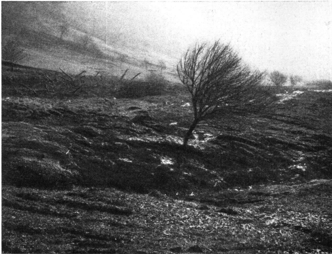
Abb.2. Westlicher Rand des Opalinustonstromes in der Obermatt. In der Mitte versunkene Waldpartie

und deckte dort den Muschelkalk mit seinen sicher früher vorhandenen Quellen zu. Nun wurde das Wasser im Muschelkalk und in der Anhydritgruppe gestaut; es kam zur Reduktion der Sulfate zu