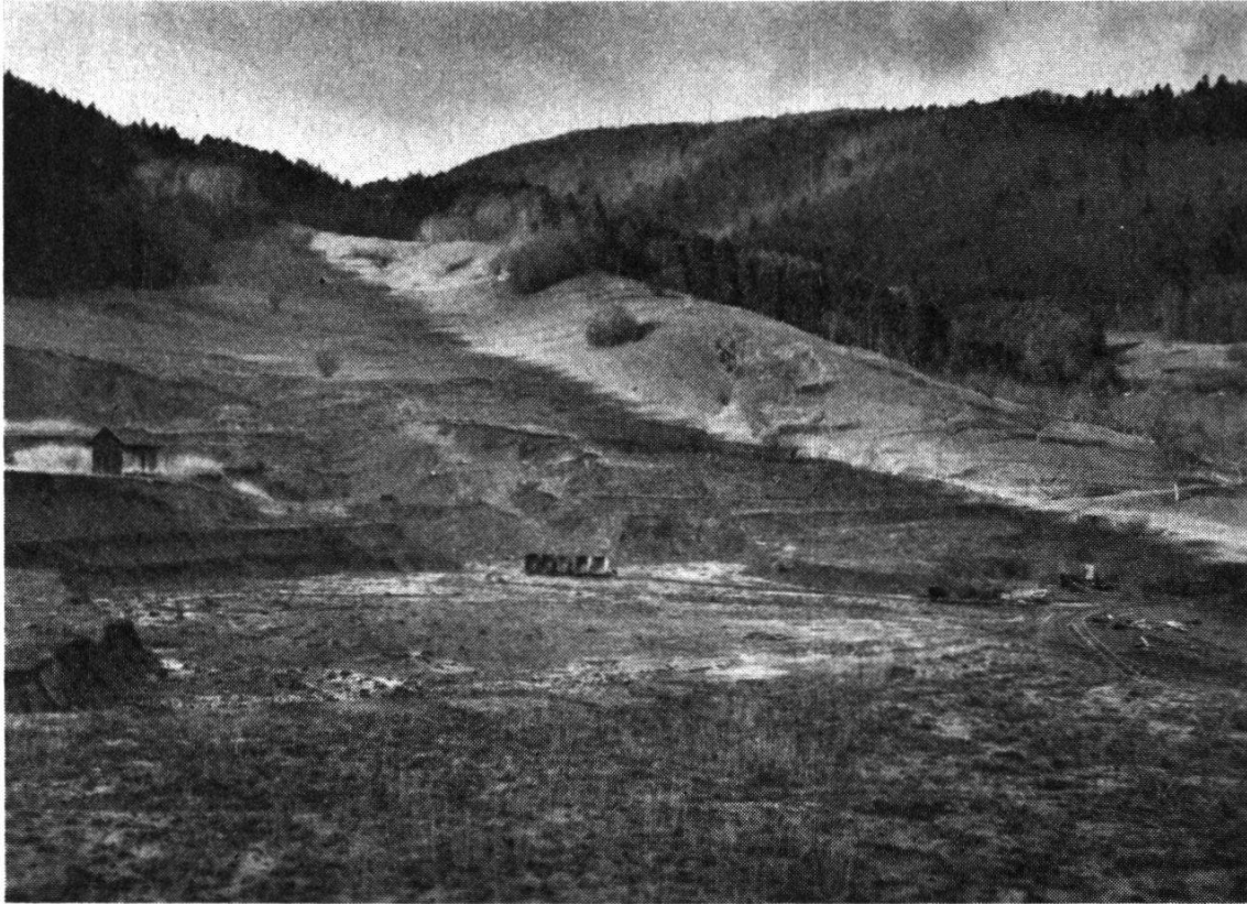
Abb.4. Opalinustonlager im «Eriwes» in Schinznach-Dorf. Vorn Tongrube der Zürcher Ziegeleien, hinten durch Rutschungen welliges Gelände

große Lager im «Eriwes» bei der Station Schinznach-Dorf. Schür- fungen, Bohrungen, geologische, chemische und keramisch-technische Untersuchungen beseitigten die anfänglichen Bedenken gegen das Material.