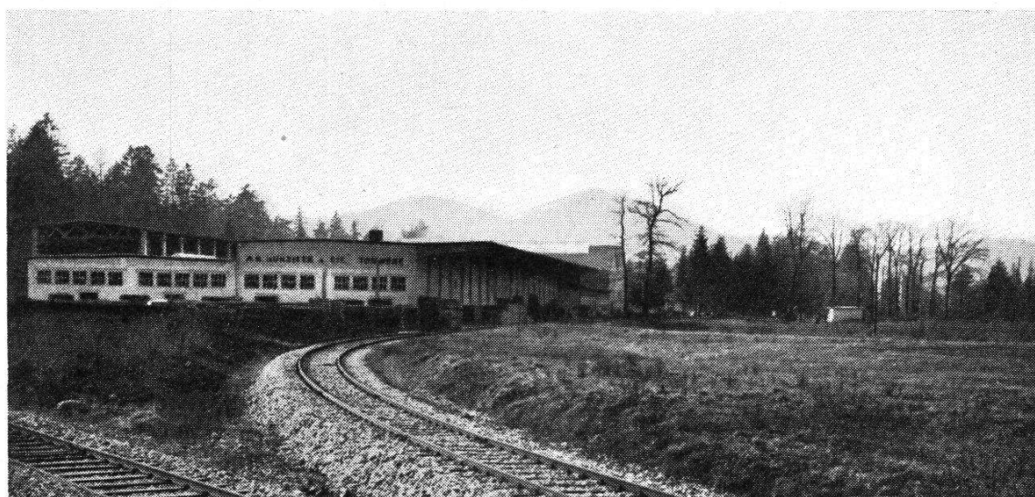
Abb. 10. Tonwerk der AG. Hunziker & Cie. in Döttingen (Dezember 1949)

Zwei Jahre später beauftragte mich die größte Baustoff-Firma der Schweiz, die AG. Hunziker & Cie, mit Sitz in Zürich, ein großes Tonlager im Gebiet des Zürichsees zu suchen. Das Studium ergab, daß im ganzen Zürichsee- und oberen Limmatgebiet kein gutes Tonlager zu finden war. Ich machte auf das einzig dastehende Lager von Böttstein aufmerksam und empfahl den Bau einer Ziegelei in D ö t t i n g e n. Die Firma ging auf diesen Vorschlag ein und baute die größte Ziegelei der Schweiz und die jetzt modernste Europas auf dem rechten Ufer der Aare in der Nähe des Kraftwerkes von Beznau und der kalorischen Kraftherzeugungsanlage der NOK (Abb. 10 und 11). Das Werk ist