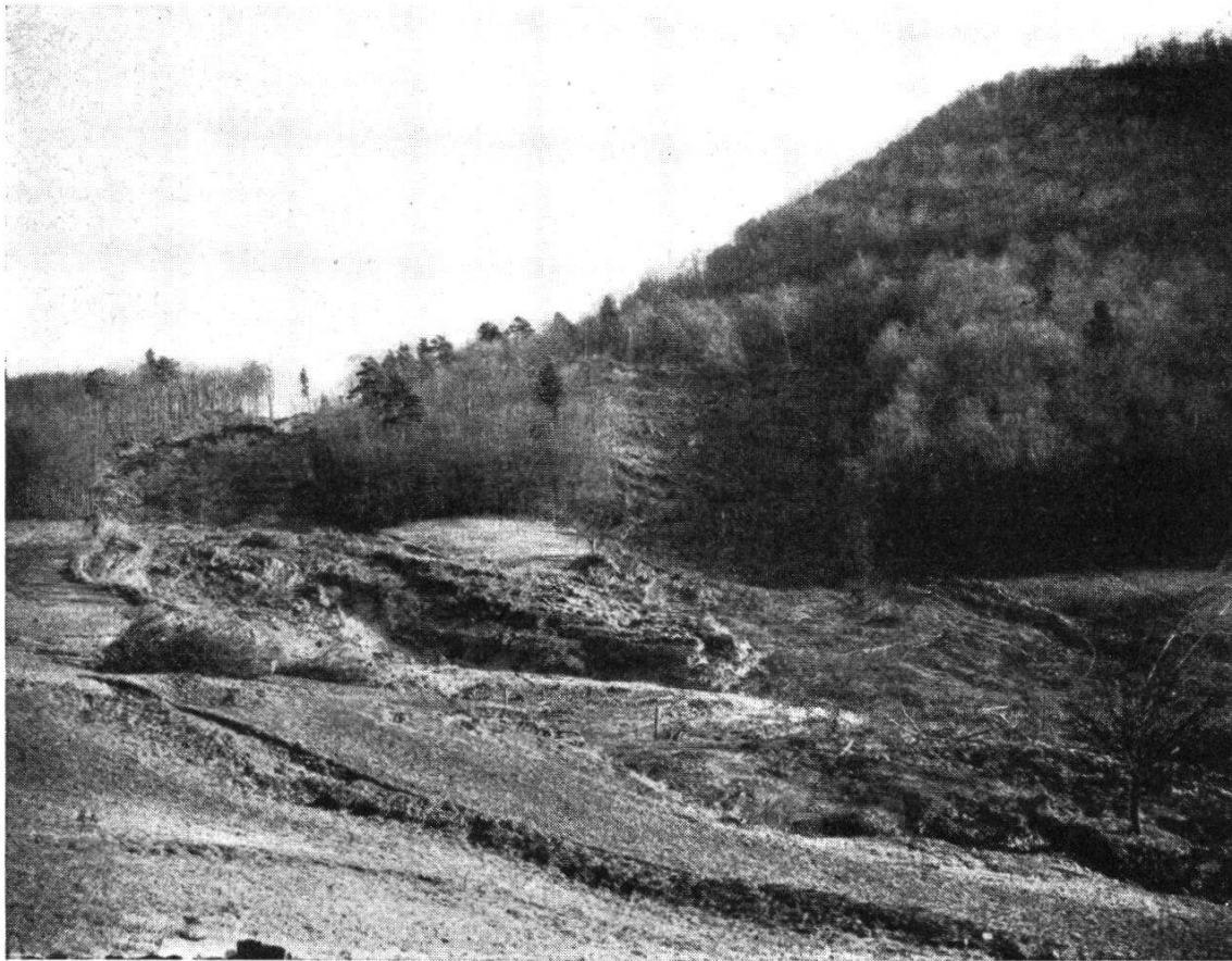
Abb. 1. Erdrutsch am Schinberg bei Ittenthal 1924/26. Oberer Abrißbrand

durch Holzkännel von 1500 m Länge und Drainageleitungen von 1735 m sowie durch Faschinenstränge von 1000 m erfolgreich bekämpft werden (s. Abb. 1 und 2).