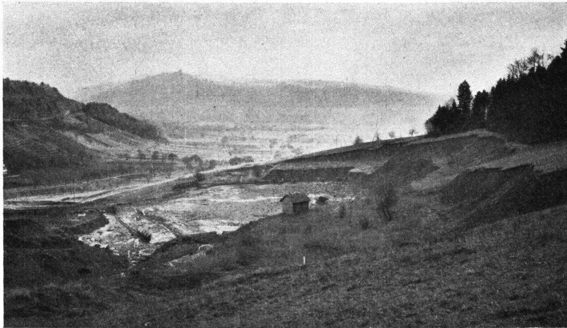
Abb. 5. Tonlager «Eriwes» mit Blick gegen Aaretal und Habsburg (Dezember 1949)

In den dreißiger Jahren sollte in nicht zu großer Entfernung von der ehemaligen Ziegelei Thut in Aarau eine neue gebaut werden. Nach vergeblichem Suchen von Ton im Mittelland schlug ich ein Opalinustonlager in Holderbank vor. Es gehört zum Südschenkel