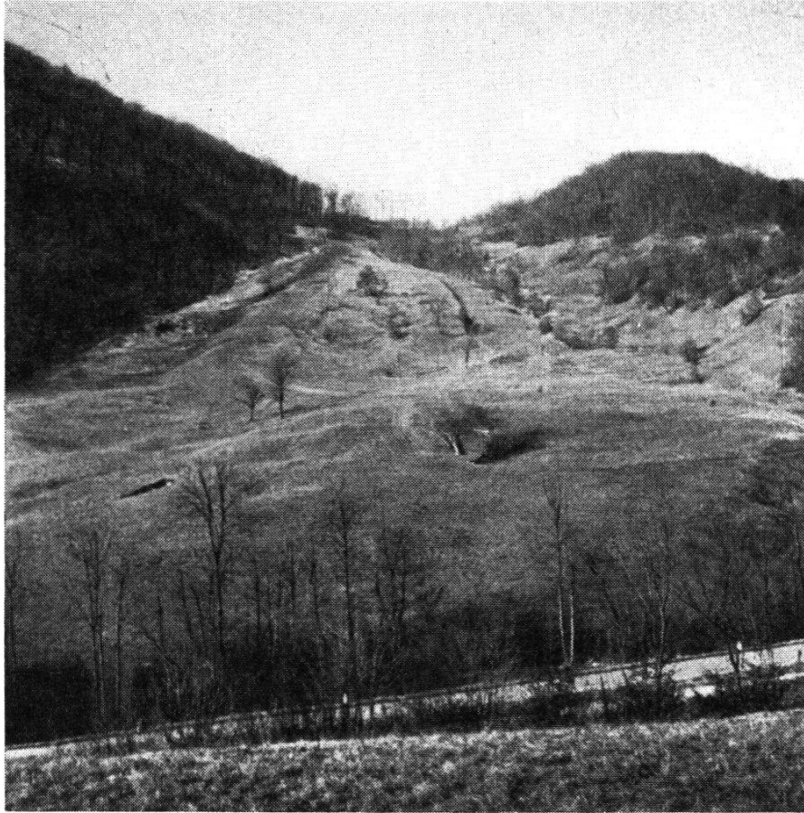
Abb. 7. Bild vom Hinterachenberg (Küttigen). Das von der Ziegelei Muri erworbene große Opalinustonlager an der Staffeleggstraße (Januar 1950)

welligen Streifen mit fetten Wiesen, in denen häufig kleinere Rutschungen vorkommen, größere aber in historischer Zeit noch nie erfolgt sind. Dagegen haben sich in der östlichen Fortsetzung dieses Tonlagers prähistorisch große Rutschungen ereignet, weil vom Biber-