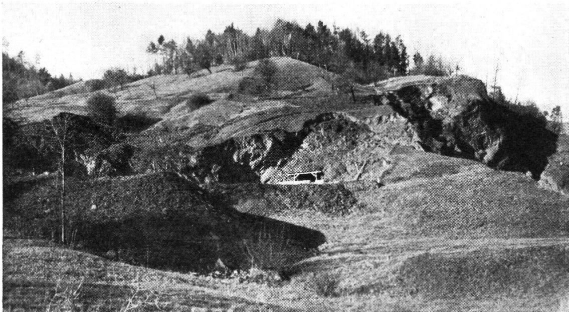
Abb. 9. Tonbruch am Schmidberg in den «Großmatten», rechts Bruch der Zementfabrik Siggenthal, links des Tonwerkes Hunziker & Cie.

Im Jahre 1942 habe ich an die Baudirektion des Kantons Aargau ein Gutachten erstattet über die vom geologischen Gesichtspunkte aus beste Anlage einer rutschsicheren Straße von Villigen nach Böttstein. Das Studium ergab, daß am Schmidberg das allergrößte Tonvorkommen der Schweiz vorhanden ist, das ausreichen würde, unser Land jahrhundertlang mit Keramikprodukten zu versorgen. Der Opalinuston kommt hier in zwei Lagern mit je 100 m Mächtig-