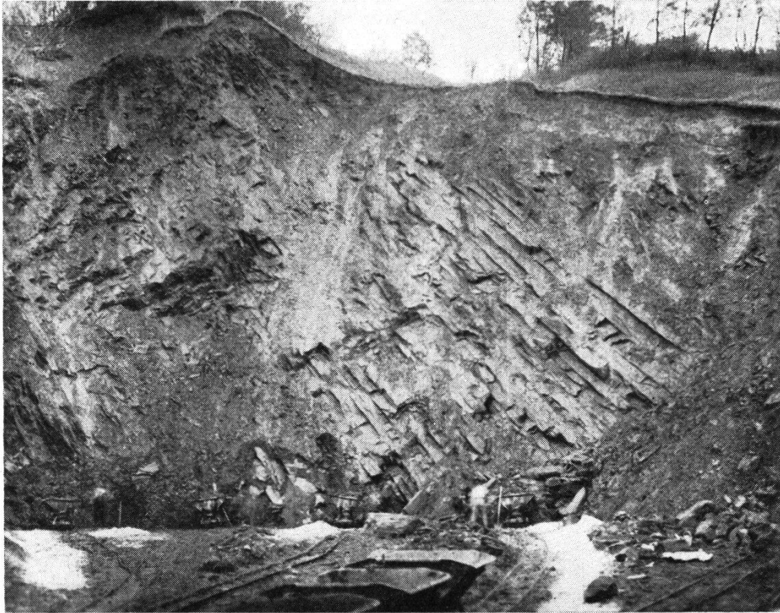
Abb.6. Bruch im Opalinuston der Tonwarenfabrik Holderbank. Die Steine werden durch Sprengen von der Wand gelöst

öfen von je 120 m Länge und 2,5 m Breite gebrannt. Es werden etwa zehn Sorten Backsteine und das gleiche Gewicht an Falz- und Biber-schwanzziegeln hergestellt. In allerjüngster Zeit hat dieses bisher