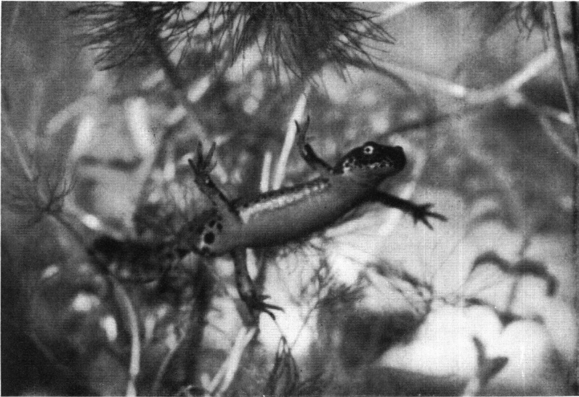
Abb. 1. Bergmolch (Männchen). Dieser farbenprächtige Molch bevölkert schon ab Mitte März in großer Zahl auch die kleinsten Tümpel und Gräben.