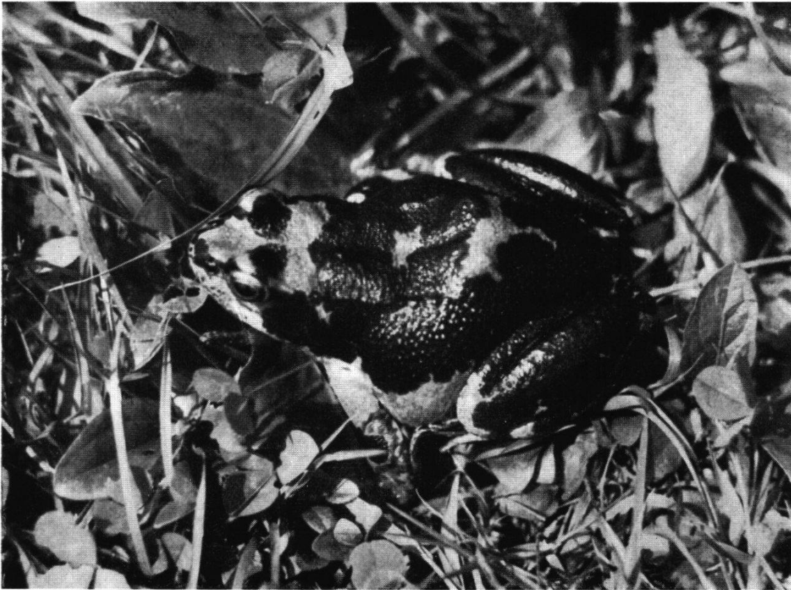
Abb. 3. Grasfroschschwärzling. Dieses außergewöhnliche Exemplar ist im August 1952 auf dem Wannenhof, Unterkulm, gefangen worden.