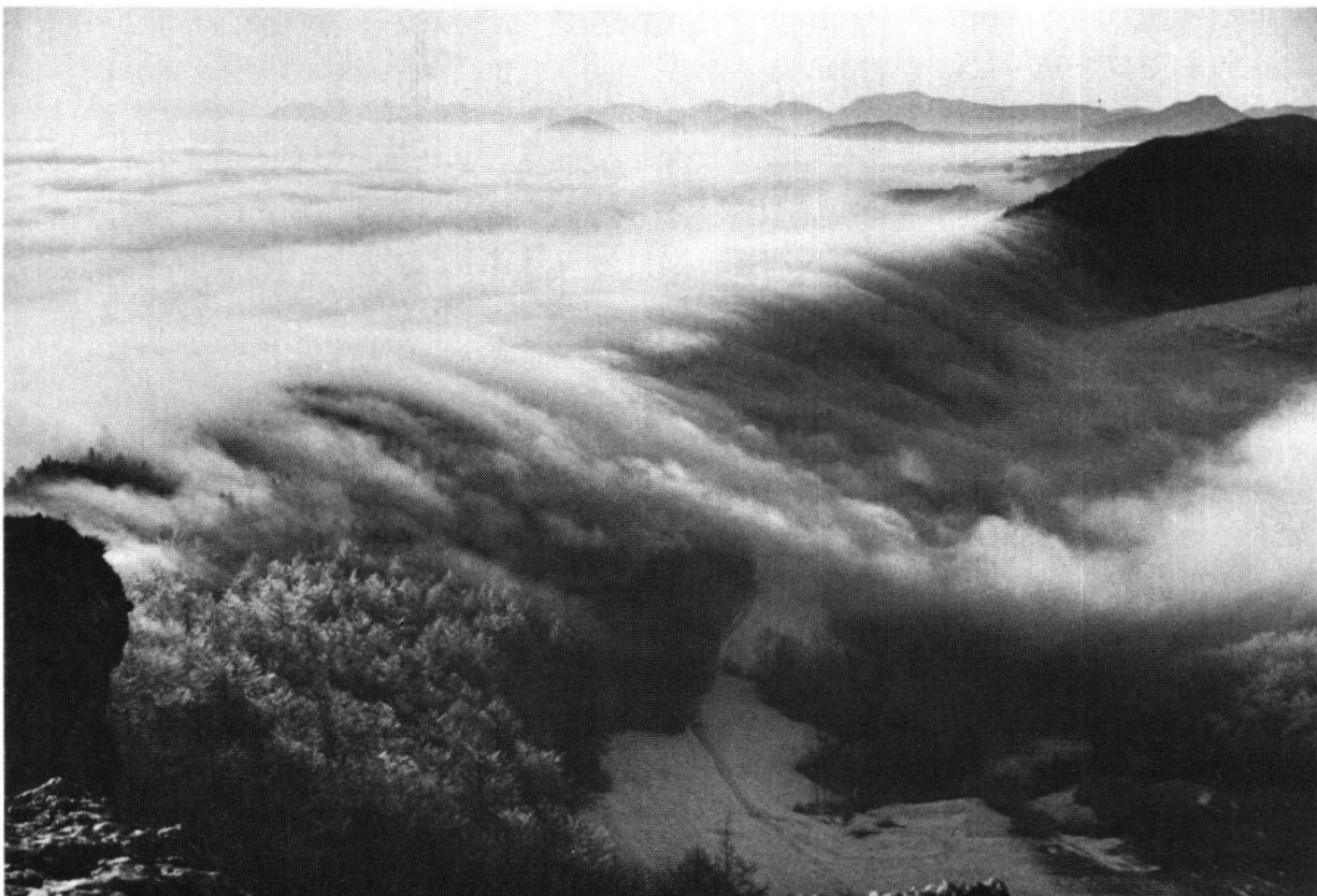
Nebel fließt über die erste Jurakette Richtung NW

Der Kupferstecher wurde bekämpft durch strenge Kontrollen, gezieltes rigoroses Aufräumen bedrohter Jungholzbestände (Abb. 7) und sofortige gründliche