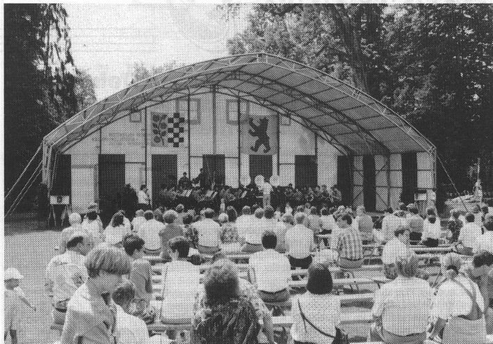
Das Bühnenzelt spendete den Musikanten Schatten und garantierte gleichzeitig für vorteilhafte akustische Bedingungen.

Höhepunkt der Veranstaltungen zum Jubiläum «25 Jahre Musikschule Cham»