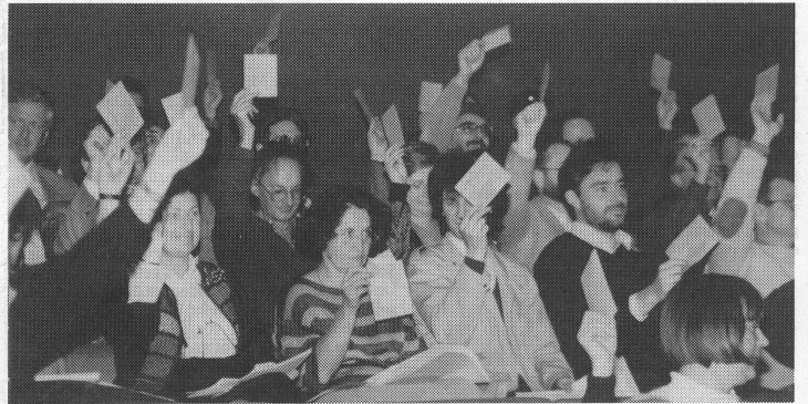
Das Tätigkeitsprogramm 1990/91 wird genehmigt.